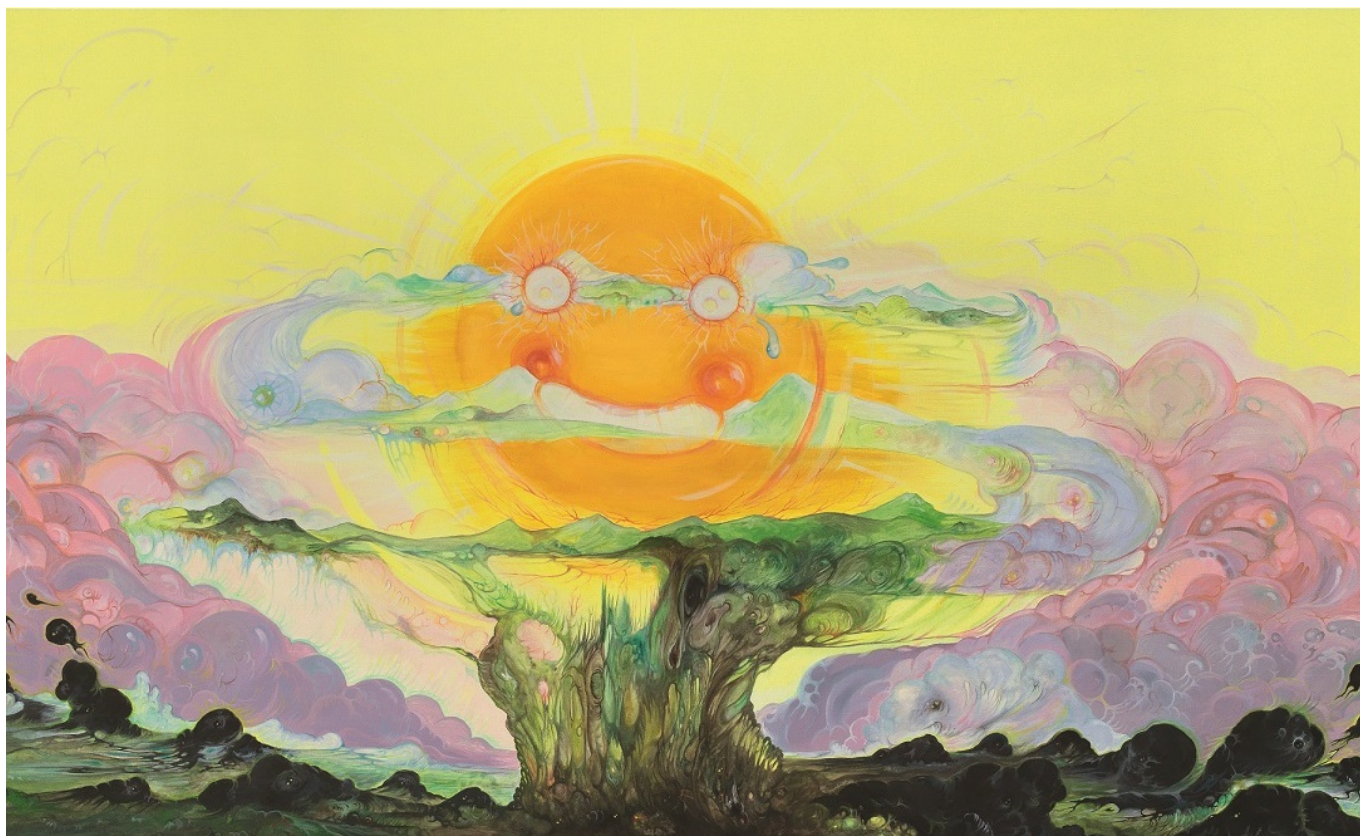
Vidya Gastaldon, Crazy, cruel and full of love, 2011

Author: Заррина Салимова, Берн , 23.10.2020.