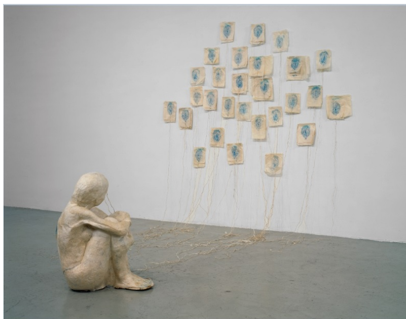
Загадочные экспонаты в МСВА

стыке культуры и науки, также здесь расположено кафе Montreux Jazz Café, ставшее своеобразным «продолжением» знаменитого джазового фестиваля в Монтре, так как в нем можно посмотреть записи старых концертов. В столице кантона Во стоит также посетить городские теплицы с сотнями тысяч растений и парк Vallée de la jeunesse – идеальное место для отдыха с маленькими детьми.