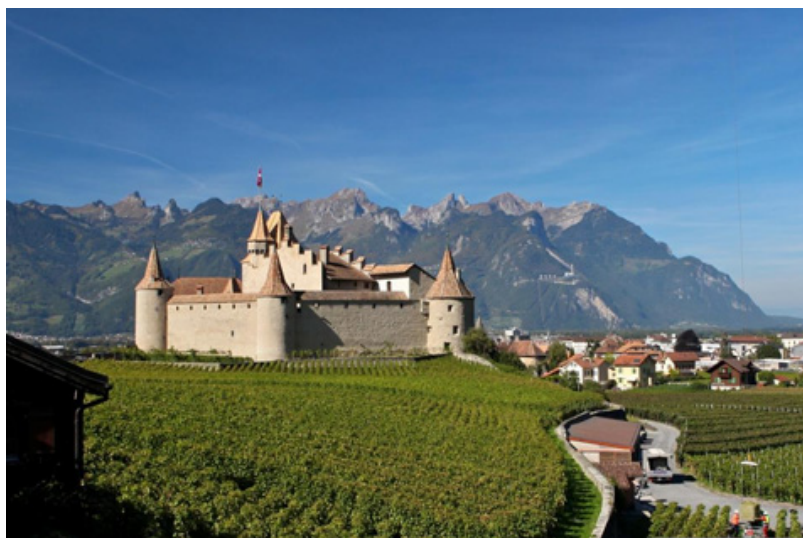
В замке Эгль туристов ждут приключения

параллельно узнать немало интересных исторических фактов. Заодно предстоит пройти по самым узким и старым улочкам города, прогуляться вдоль живописных виноградников и осмотреть замок.