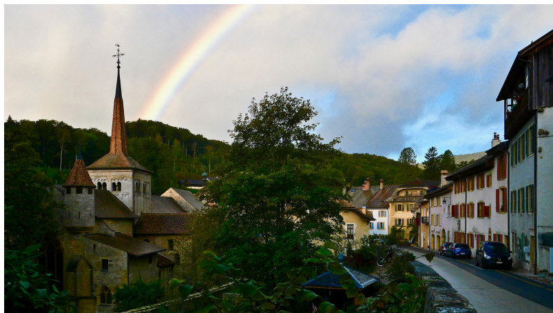
Радуга над Роменмотье

На южном берегу Невшательского озера расположена заболоченная местность Grande Cariçaie длиной 40 километров, где на площади 3000 га произрастают около 800 видов растений и обитают более 10 тыс. видов животных. В центре наблюдения за дикой природой BirdLife в Кюдрфэн (кантон Во) можно увидеть разных птиц, а также бобров, которые облюбовали себе местечко на территории центра. В Сионе два беспилотных автобуса SmartShuttle курсируют между железнодорожным вокзалом и исторической частью города. Желающие узнать, каким будет транспорт будущего, могут бесплатно прокатиться.