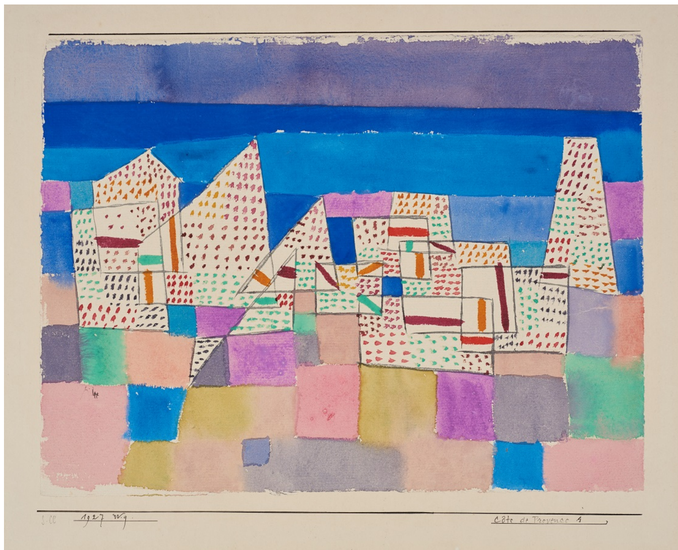
Paul Klee, Côte de Provence 1, 1927 © Zentrum Paul Klee, Bern

Author: Заррина Салимова, Берн , 09.09.2020.