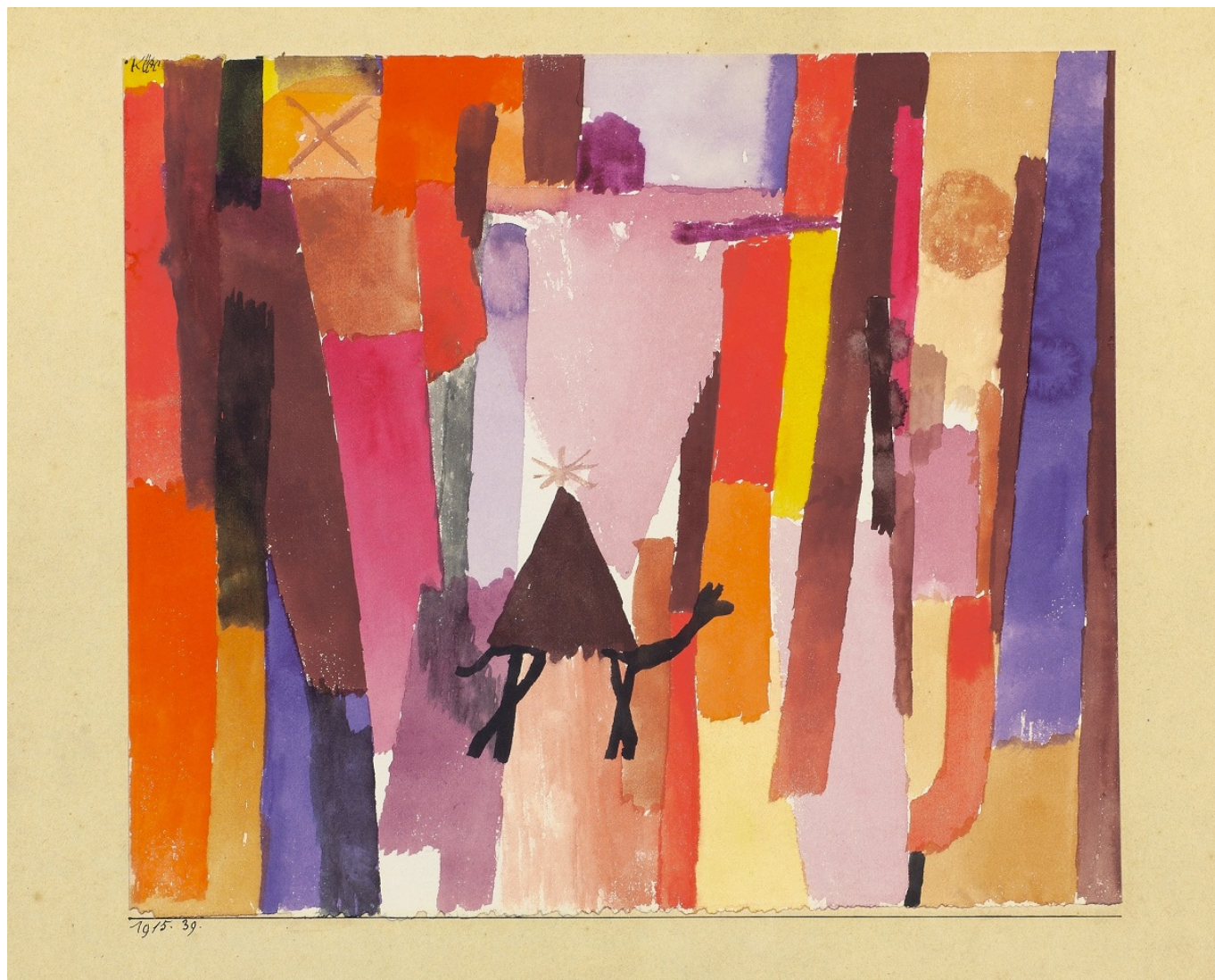
Paul Klee, , 1915, © Kunstmuseum Bern

проследить процесс превращения Клее из растерянного студента в одного из главных художников-авангардистов своего времени через рассказ о его поездках по разным городам – отерна, где он родился и вырос, и Мюнхена, где он учился, до его путешествий по Франции, Италии, Тунису и Египту и возвращения в Берн, где ему, представителю «дегенеративного искусства», пришлось жить фактически в изгнании, спасаясь от нападков нацистов.