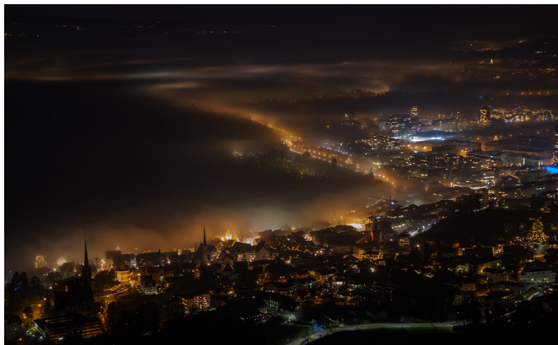
Ночной Цуг

На ул. Neugasse 27 в Цуге стоит зайти в ювелирный магазин фирмы Lohri – по этому адресу мастера работают с благородными металлами с 1620 года. Второе поколение семьи Лори управляет зданием, реставрированным в стиле ампир. Сотрудники туристического офиса Цуга помогут вам организовать посещение пчелиной фермы Arbach, фабрики специй Oswald, а также пивоварни, где эксперты расскажут, как приготовить пенистый напиток приятного золотистого оттенка. Наконец, отправившись на экскурсию «Made in Zoug», вы прогуляетесь по старой части города и познакомитесь с молодыми дизайнерами одежды, мебели, керамических изделий и ювелирных украшений.