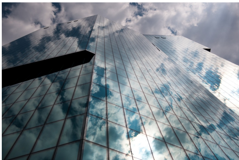
Небоскреб Prime Tower

примеров – квартал Zurich-Ouest, в котором находится 126-метровый небоскреб Prime Tower (ул. Hardstrasse 201) – второй по высоте после 178-метрового Roche Tower в Базеле. Конечно, американцев и китайцев такой высотой не удивишь, но для Швейцарии это немало. Из окон панорамного ресторана Clouds, расположенного в Prime Tower, открывается прекрасный вид на город.