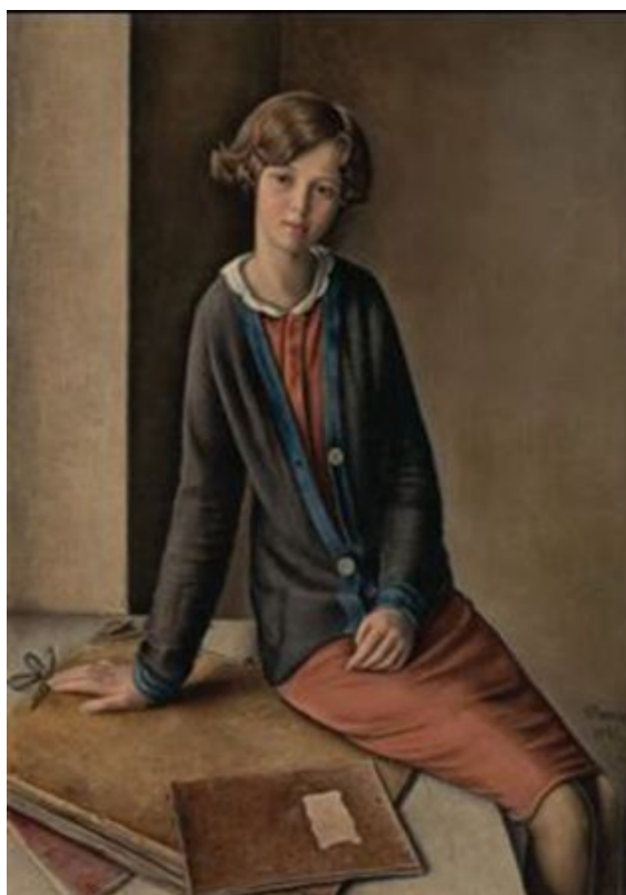
Франсуа Барро, «Портрет девушки», 1932 г. © Aargauer Kunsthaus, Aarau / Depositum Sammlung Werner Coninx

В Кунстхаусе Аргау проходят экскурсии в сопровождении гида для групп, включающих не более четырех человек. В настоящее время в Кунстхаусе представлены экспозиции «Коллекция Вернера Конинкса», «Дениз Бертши» и «Караван 1/2020: Доминик Мишель», которые продлятся до 9 августа этого года. В Кантональном музее археологии и истории (Лозанна) до 28 июня работает выставка «У истоков Средневековья», иллюстрирующая историю человечества в 350-1000 гг. н.э.: здесь можно будет увидеть произведения искусства известных мастеров и образцы работ ремесленников, недавние археологические находки и многое другое, что, возможно, заставит посетителей пересмотреть свои представления о той далекой эпохе.