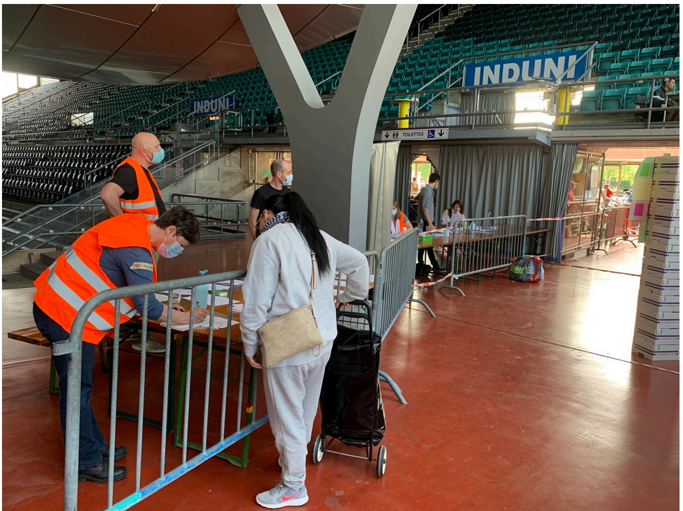
Распределение бесплатной еды в Женеве.

Несмотря на то, что ограничения способствуют сдерживанию эпидемии и снятию нагрузки с системы здравоохранения, многие считают, что запреты нарушают фундаментальные гражданские права. 9 мая в Берне, Цюрихе, Базеле и Санкт-Галлене несколько сотен человек вышли на улицы с требованиями отменить чрезвычайные меры, причем некоторые демонстранты размахивали Конституцией Конфедерации. В Берне полиция использовала громкоговорители, чтобы призвать участников демонстрации разойтись, но не применяла силу, так как среди демонстрантов было много пожилых людей и семей с детьми. В других городах акции также завершились мирно.