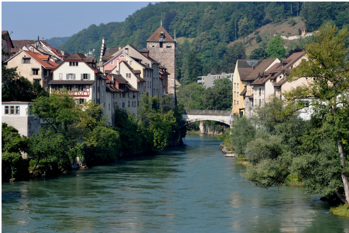
Старинный мост над Ааре в Бругге, где похоронен Песталоцци

Жуковский мечтал о личной встрече со швейцарским педагогом. В одном из писем к своему другу И. И. Дмитриеву Василий Андреевич говорит о своем желании не просто познакомиться с Песталоцци, но и поучиться у него тому, как стать полезным своему народу: «Я мечтаю о путешествии в Швейцарию, о двух-трех годах, проведенных у Песталоцци, для того чтобы завести что-нибудь подобное его институту в России и быть через то истинно полезным». Забегая вперед, скажем: во время путешествия по Швейцарии в 1821 году Жуковскому не удастся повидаться с Песталоцци, о чем он будет искренне сокрушаться.