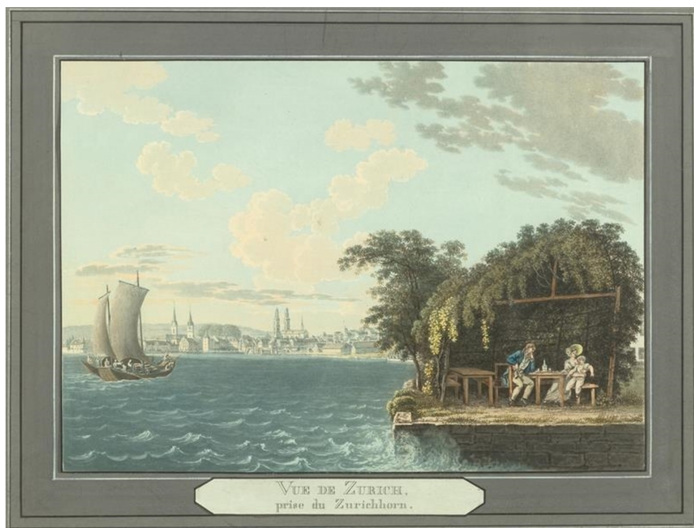
Цюрих – родина Песталоцци. Старинная акварель.

Неудача не сломила Песталоцци, он нашел другую возможность служить делу, которому решил посвятить жизнь. На протяжении последующих восемнадцати лет он пишет книги, посвященные проблемам воспитания и обучения детей. О чем же они? Главная его мысль – образование нужно всем и является фундаментальным правом людей, рожденных равными. Песталоцци идет еще дальше в своих размышлениях, заявляя, что именно во всеобщем образовании залог процветания государства. По его мнению, никакие прогрессивные реформы не утвердятся, если они не будут поддержаны народом, если все население не будет понимать их значения и важности.