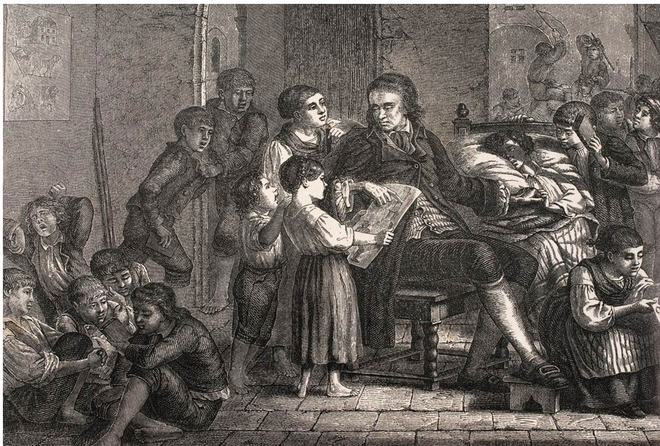
Песталоцци в окружении детей. Старинная гравюра.