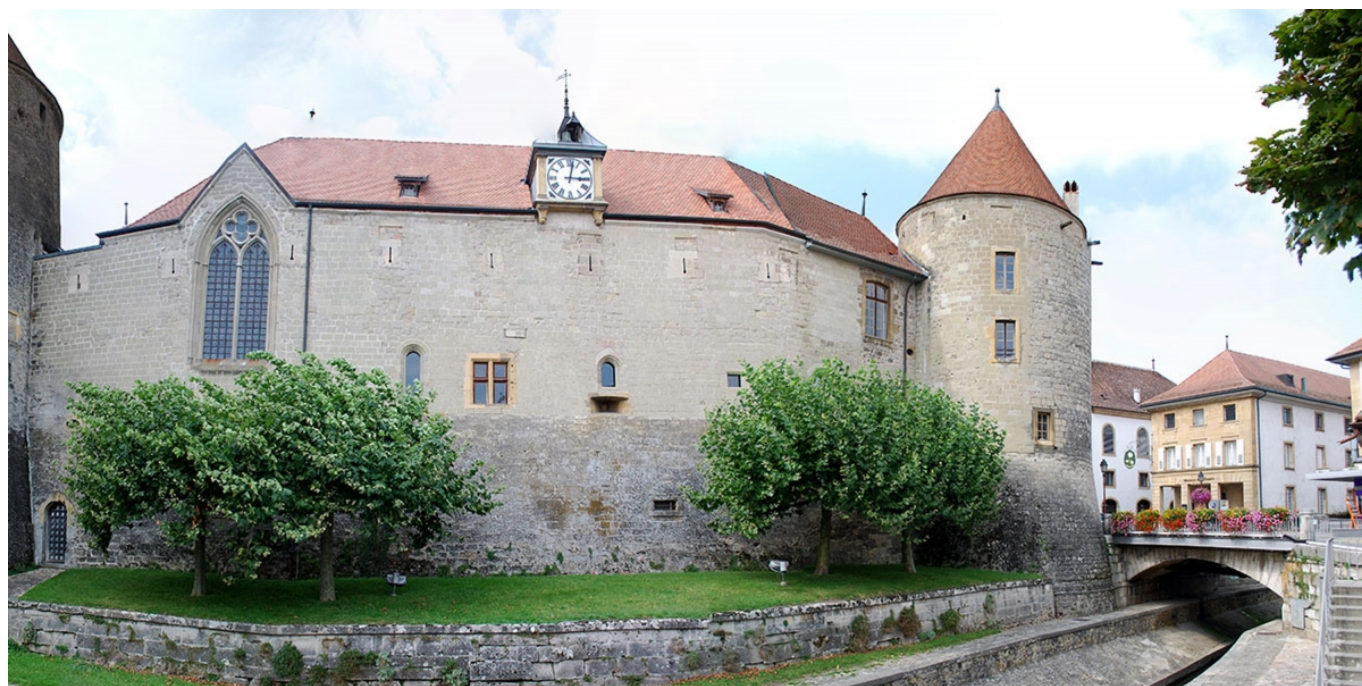
В этом замке находился Ивердонский институт Песталоцци

Очередной крах, но Песталоцци и на сей раз не сдается. С помощью друзей, в 1800 году, он устраивается на работу в школу города Бургдорф, в кантоне Берн, где получает возможность начать преподавание по своей методике. Успехи его учеников настолько очевидны, что в итоге, совместно с горсткой единомышленников, он открывает Педагогический институт. В 1804 году Песталоцци был вынужден в очередной раз переезжать, поскольку замок в Бургдорфе понадобился Бернским властям, но его институт пользовался уже такой известностью, что сразу несколько кантонов предложили ему помещения.