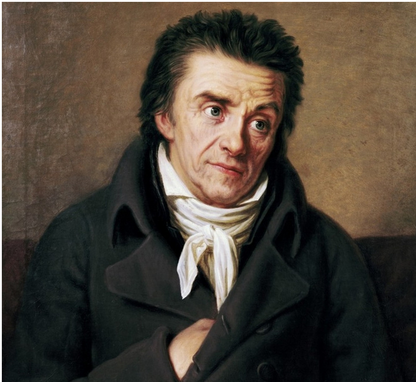
Г. Ф. А. Шонер. Портрет Иоганна Генриха Песталоцци. Холст, масло. 1774 год

Все, знавшие Песталоцци в юности, отмечали его крайнюю восприимчивость к чужому горю. Уже в юном возрасте он понял, что главная цель его жизни – служить отечеству, помогать тем, кто в нем нуждается. Вот, например, о чем он предупреждает свою невесту: «Я должен сознаться, что мои обязанности к жене будут всегда подчинены обязанностям к моему отечеству, и хотя я буду нежнейшим супругом, я все же останусь равнодушным к слезам жены, если увижу, что она хочет удержать меня от исполнения гражданских обязанностей. <> Мое сердце принадлежит моей родине, и я решусь на все, чтобы хоть немного смягчить горе и нищету в моем народе».