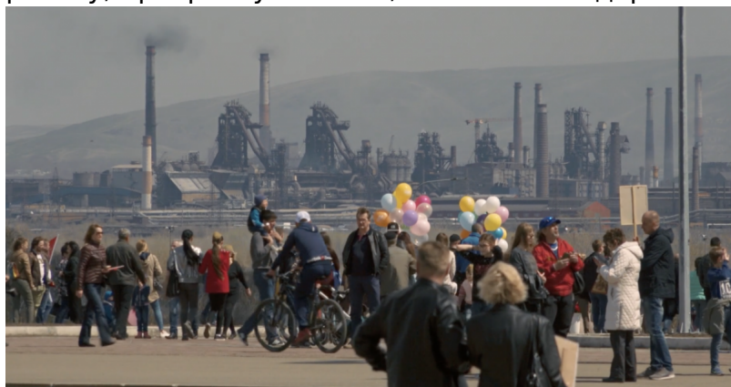
(© кадр из фильма «Комбинат»/Gabriel Tejedor)

Я с удивлением увидел, что в таком удаленном от центра городе есть вегетарианский ресторан, люди занимаются йогой, танцуют сальсу: глобализация заметна везде. Я бы не согласился с утверждением о том, что Россия – закрытая страна, стремящаяся к самоизоляции. Временами мне казалось, что я не покидал Женеву, так все было похоже. Я бы даже опроверг постулат о том, что существует специфический русский характер – в конце концов, мы очень похожи, близки, если не принимать во внимание эмоциональность. Правда, поначалу бывает холодок в общении, натянутость, но потом, когда мы лучше узнаем друг друга, складываются прекрасные отношения, очень искренние и благородные. Хотя у нас и разная действительность, но ценности одни – и здесь, и там все хотят иметь хорошую работу, прекрасную семью, заботятся о здоровье своих детей.