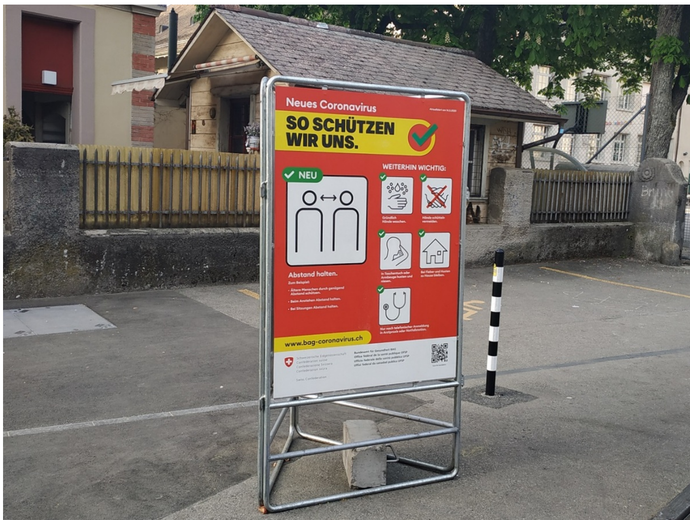
Правила социальной дистанции останутся с нами еще надолго.