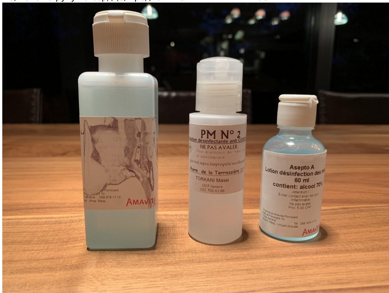
Такие разные пузырьки

Многие возмущаются, почему правительство не приняло более радикальных мер, например, не объявило тотальный карантин. В демократической стране сделать это сложнее, чем при тоталитарном режиме. Не исключено, однако, что все к этому идет. Но, положив руку на сердце, предпочли бы вы жить в Китае?