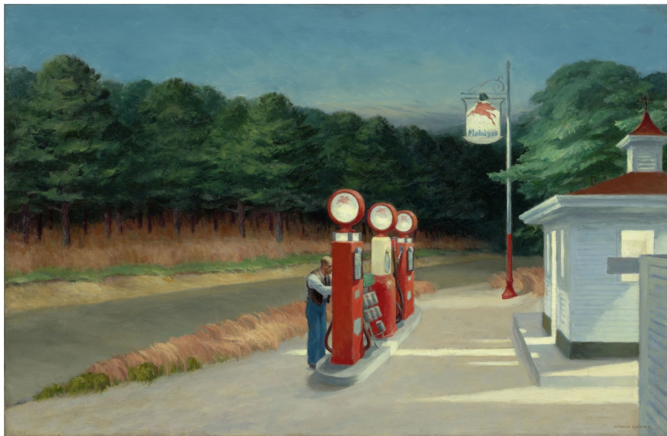
Эдвард Хоппер. Газозаправочная станция, 1940 г. The Museum of Modern Art, New York, Mrs. Simon Guggenheim Fund © Heirs of Josephine Hopper / 2019, ProLitteris, Zurich © 2019 Digital image, The Museum of Modern Art, New York / Scala, Florence

Эдвард Хоппер родился в городе Найак, штат Нью-Йорк. Выучившись на иллюстратора, он до 1906 года продолжал постигать секреты живописного мастерства в Нью-Йоркской школе искусств. Наряду с немецкой, французской и русской литературой в становлении молодого художника сыграли большую роль такие мастера живописи, как Диего Веласкес, Франсиско де Гойя, Гюстав Курбе и Эдуар Мане. Хотя долгое время Хоппер занимался, главным образом, иллюстрацией, особенно известна его масляная живопись, которая свидетельствует о его глубоком интересе к цвету и исключительном умении передавать свет и тень.