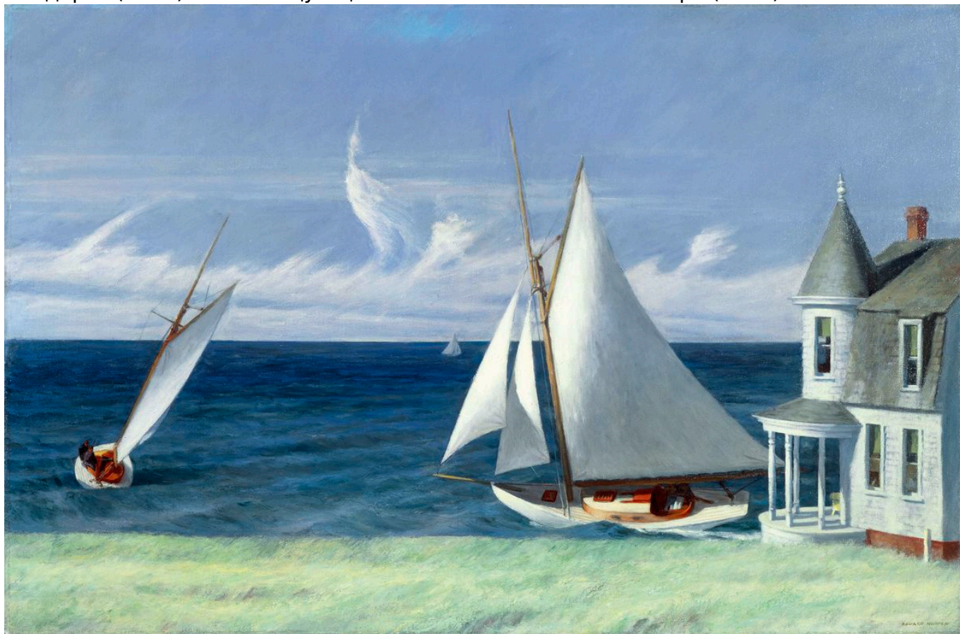
Эдвард Хоппер. Побережье Ли, 1941 г. The Middleton Family Collection© Heirs of Josephine Hopper / 2019, ProLitteris, Zurich

северу через северо-запад» Альфреда Хичкока (1959), «Париж, Техас» Вима Вендерса (1984) или «Танцующий с волками» Кевина Костнера (1990).