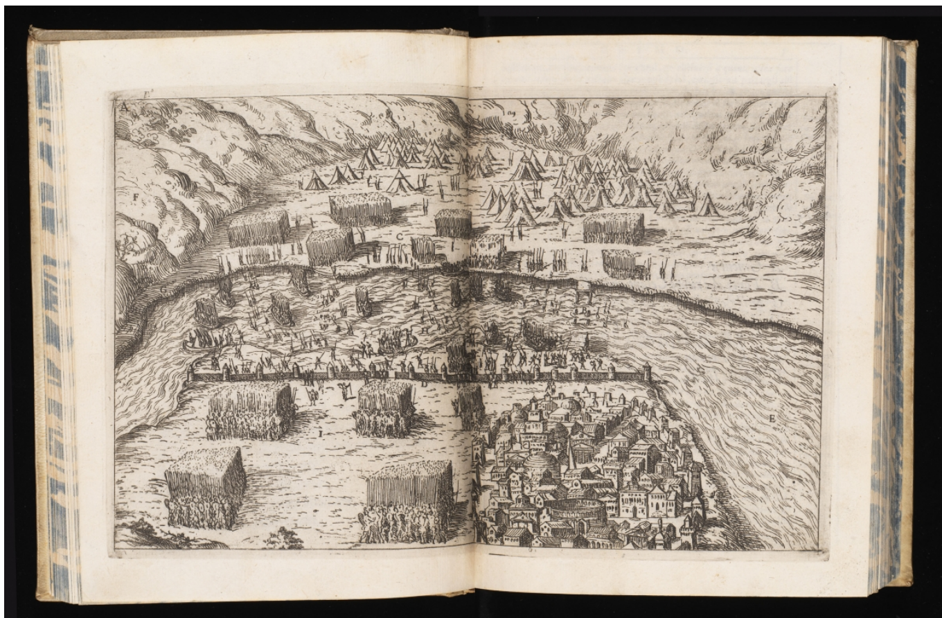
Гай Юлий Цезарь (100-44 av. J.-C.) "Записки", Венеция, издание Пьетро де Франкеши, 1575, иллюстрации Андреа Палладио

В гораздо более отдаленную от нас во времени, но не менее кровавую эпоху переносят «Записки о Галльской войне» Гая Юлия Цезаря, в восьми книгах которых великий полководец древности в точной, сжатой и энергичной манере, вызывавшей восхищение всех, от Цицерона до Руссо, описал своё завоевание Галлии в 58-50 гг. до н. э.. Устроители выставки обращают внимание на то, что, как описано в Книге первой, легионы Цезаря тогда защищали Женеву от гельветов – до того, как стать оазисом мира, наш город побывал и в роли зоны конфликта.