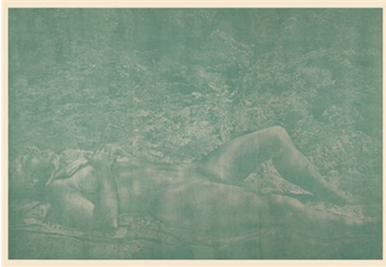
Франц Герч, «Мария», 2001 г.

В 2012 году его картина «Frühling» (нем.: Весна) была использована в качестве фона для официальной фотографии правительства Швейцарии. Тогда в своем коммюнике Федеральная канцелярия написала, что весна – сезон обновления, а фото подчеркивает устремленный в будущее взгляд правительства. В том же году работы Герча по дереву появились на марках специальной серии «Pétasite», «Graminées» и «Schwarzwasser», выпущенных Почтой Швейцарии.