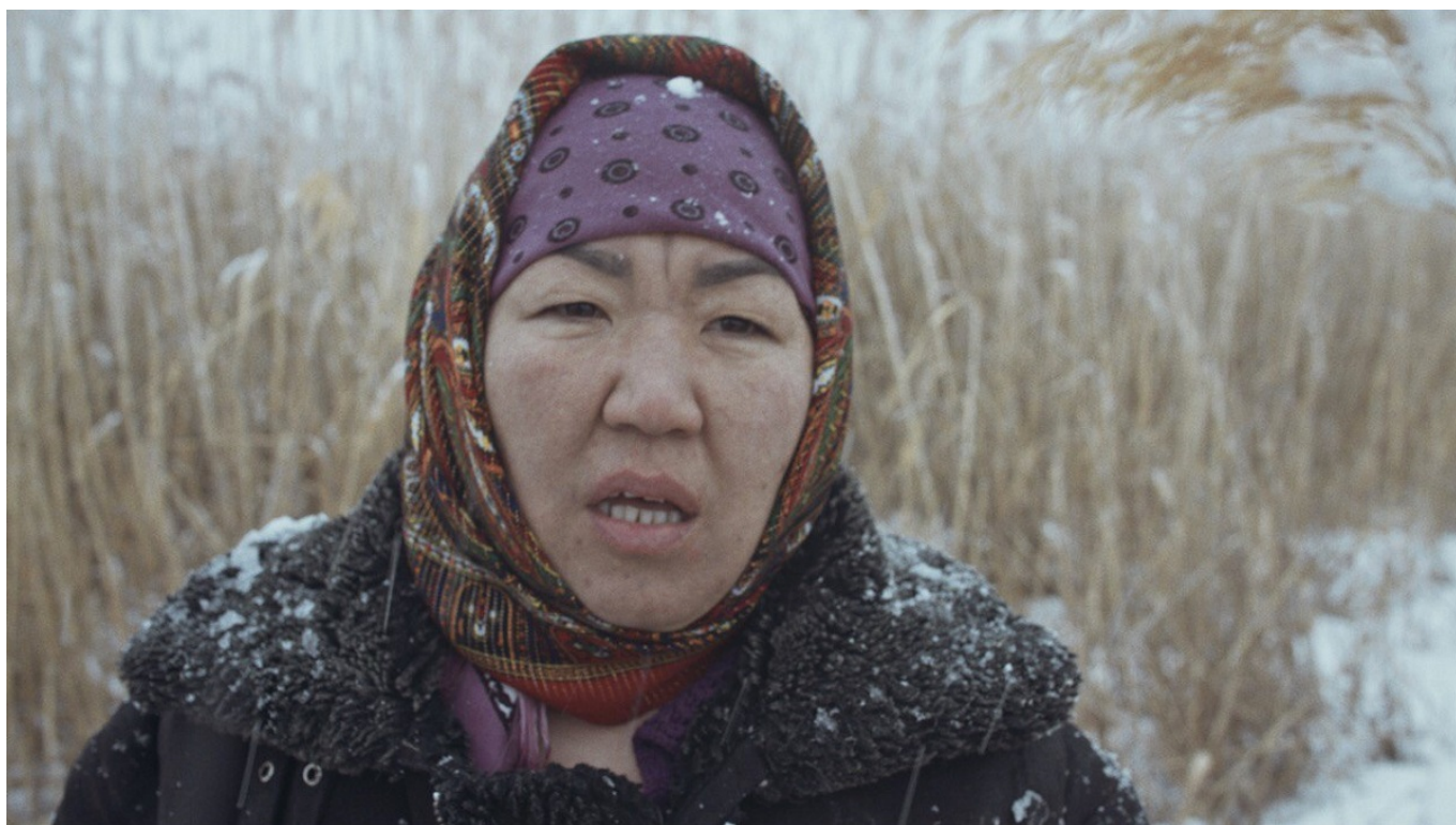
Кадр из фильма «Мариям»

В программе фестиваля представлены несколько фильмов, снятых режиссерами из России, Украины, Грузии, Армении и Казахстана. Так, в основной конкурс вошла дебютная полнометражная картина казахстанского режиссера Шарипы Уразбаевой «Мариям» . В основу фильма легла реальная история матери четырех маленьких детей, на плечи которой свалился груз ответственности после таинственного исчезновения ее мужа.