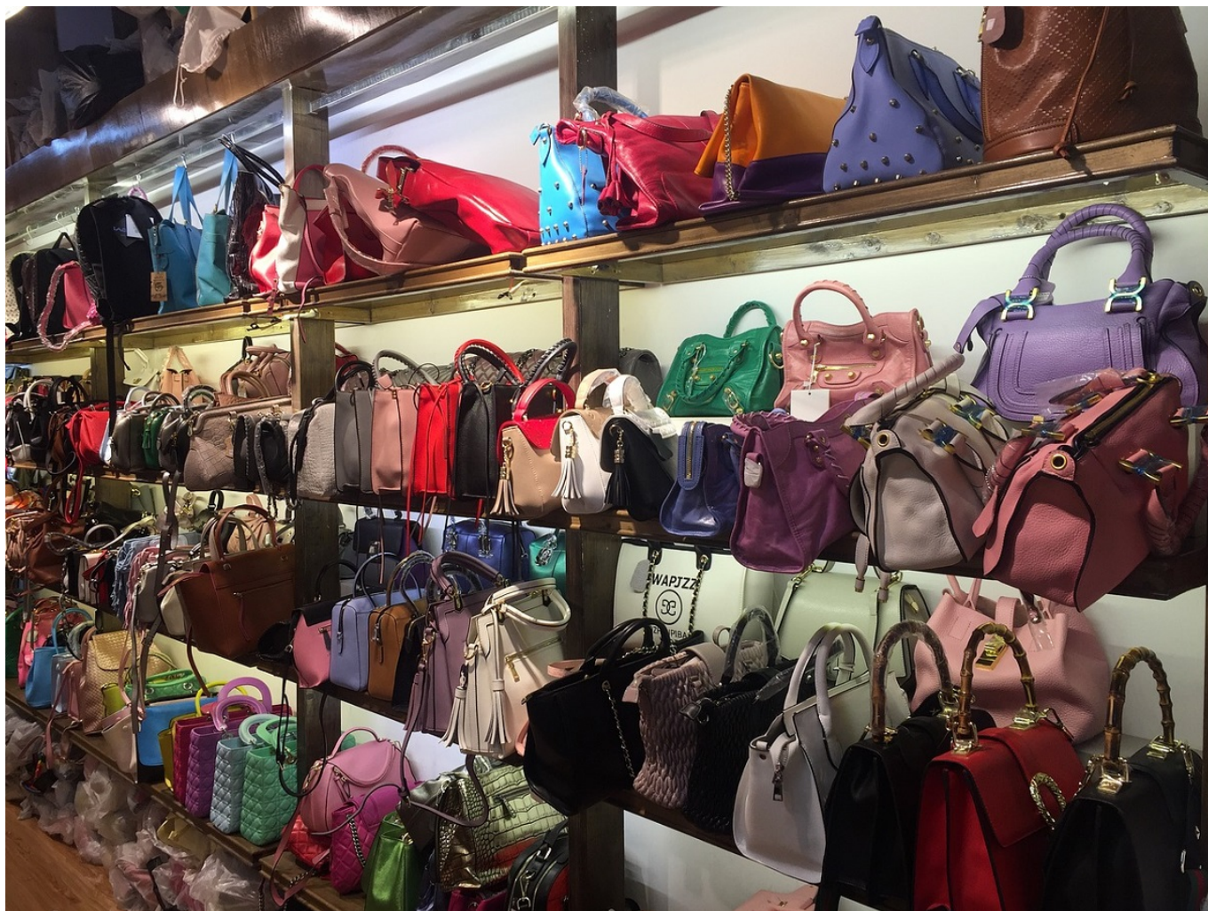
Люкс за 20 долларов...

Author: Зарина Салимова, Берн , 11.07.2019.