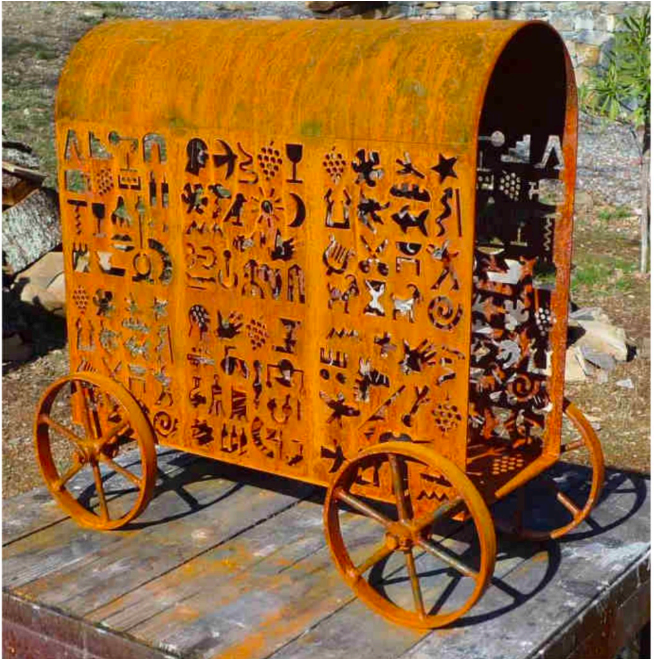
Вот она, историческая повозка