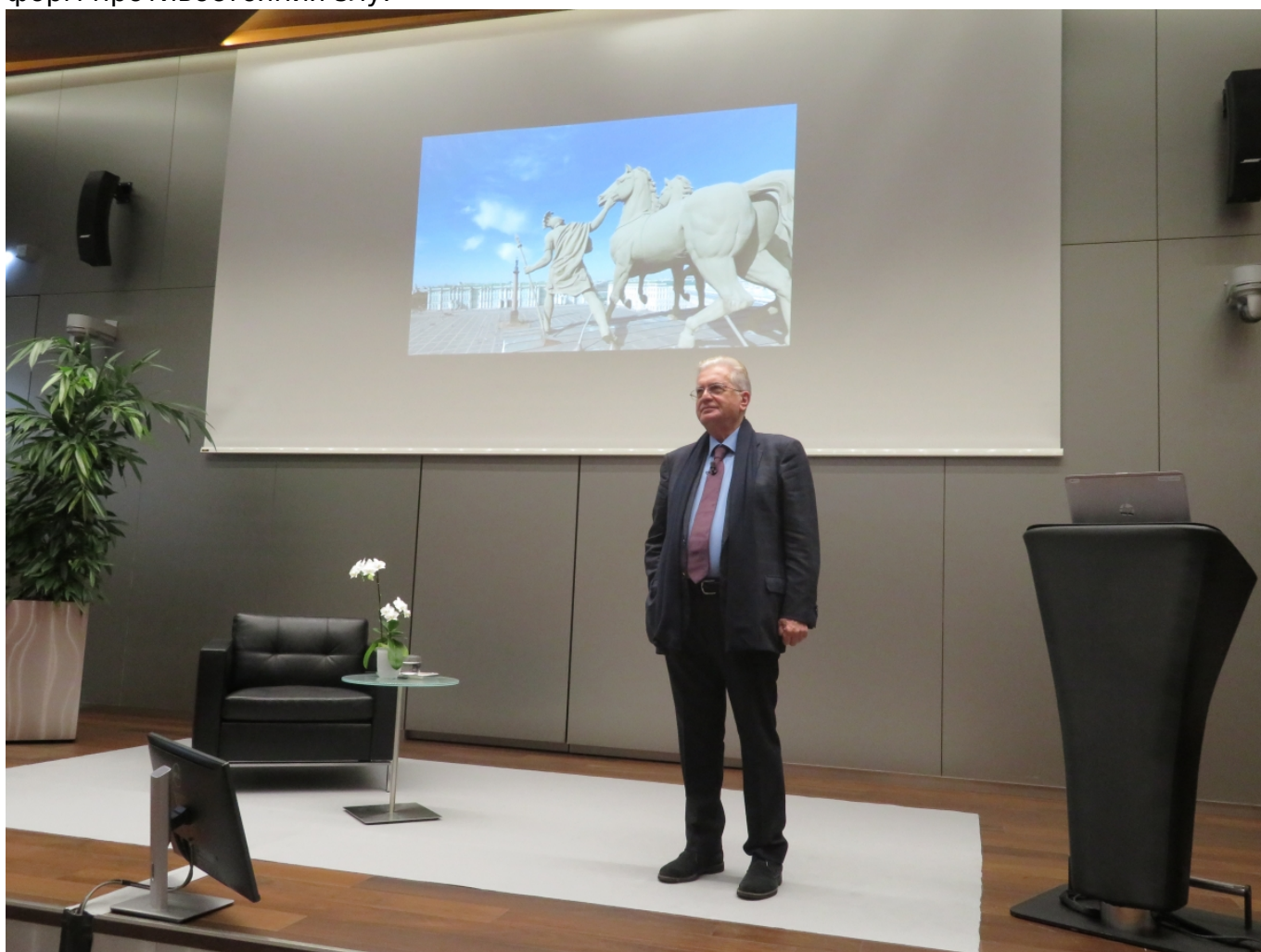
Михаил Пиотровский рассказывает об Эрмитаже сотрудникам JTI. Женева, октябрь 2017 г.

Мне кажется, это момент буржуазного лицемерия, я не понимаю, что тут было плохого. Понятно, что тот концерт был не для эстетов, а для простых людей и имел прежде всего символическое значение. Это был концерт в пустом городе, музыка была символом жизни. Ну и вызовом, конечно, на который террористы ответили тем, что потом отрубали в этом театре головы. Тот концерт можно сравнить с исполнением симфоний Шостаковича в блокадном Ленинграде. Искусство – одна из форм противостояния злу.