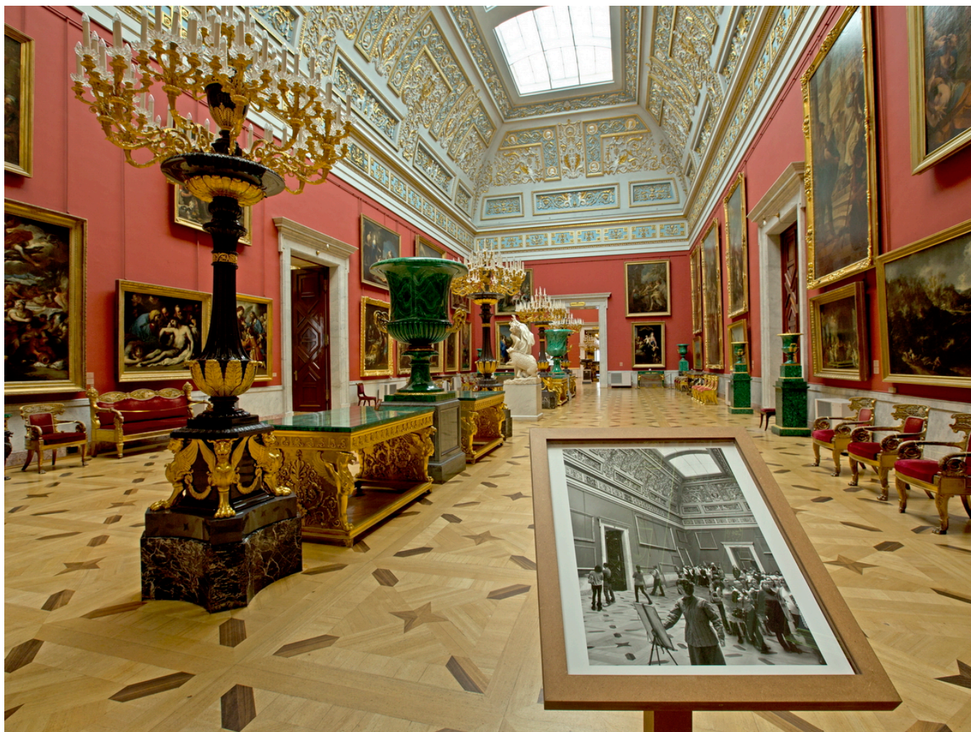
Моримура Ясумаса. Эрмитаж, 1941-2014. 2014 г.