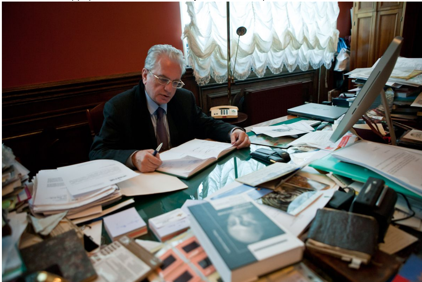
Михаил Пиотровский в своем кабинете

лучше, кто древнее, кто первый пришел и т. д. У многих мусульман сильна память колониального унижения, а у европейцев, наоборот, колониального превосходства. Диалог культур, который создает наука востоковедение, крайне полезен. Он показывает, что все религии на самом деле похожи и не страшны, если не используются в качестве знамени чего-то, к религии отношения не имеющего. А что касается страха, то, как мы видели в России в 1990-е годы, не было никакого исламского терроризма, но за каждым углом было страшно.