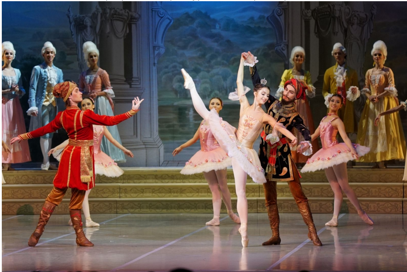
Сцена из спектакля "Спящая красавица"