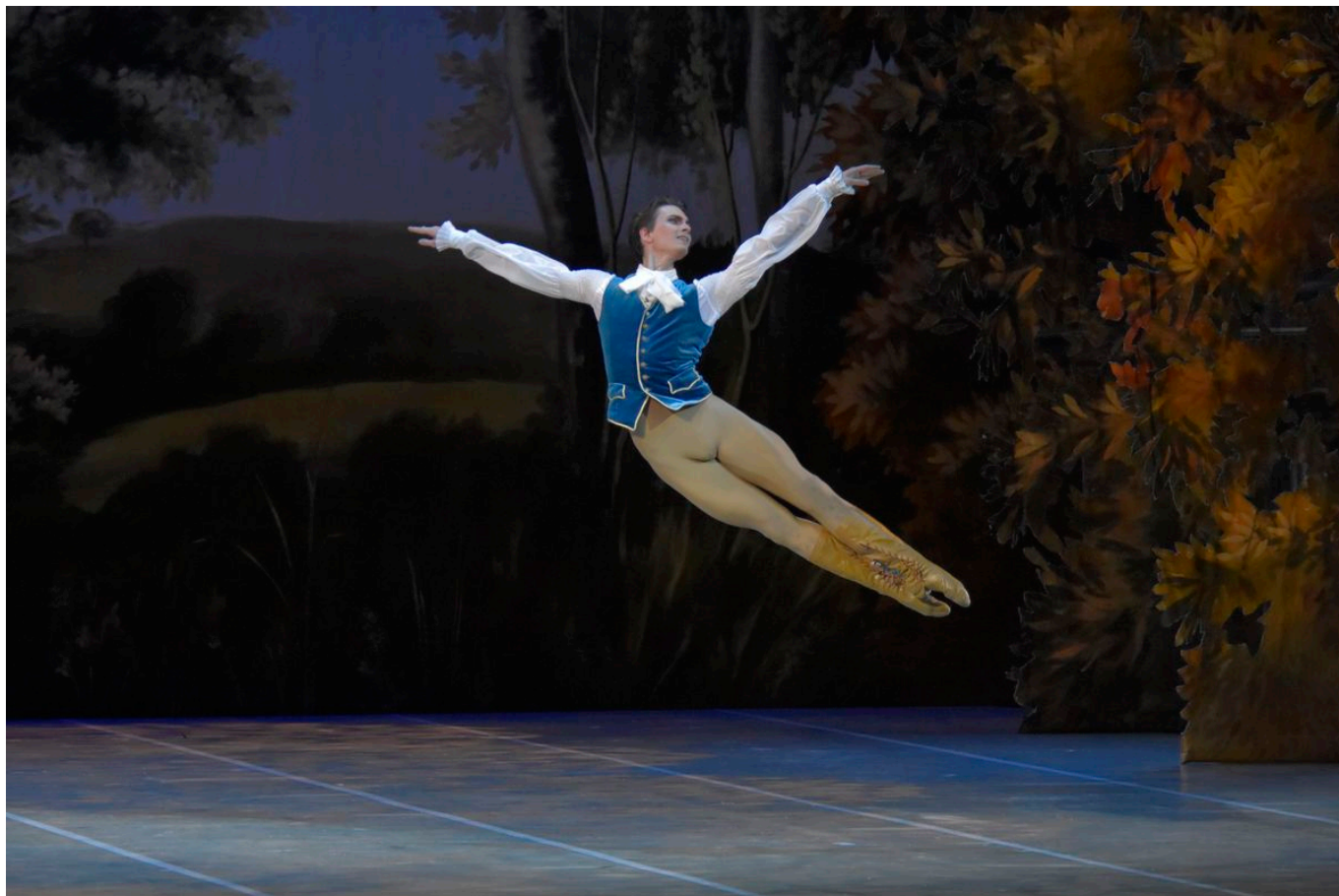
Сцена из спектакля "Спящая красавица"

«Балет для меня – это прежде всего история, рассказанная танцем, а не просто возможность дать блеснуть танцовщику или танцовщицам. Классическая хореография, как поэзия или музыка, имеет собственную динамику, экспрессивность и способность нести идею. Разве не наблюдаем мы сегодня настоящую драматическую работу в театре или в опере, особенно в том, что касается работы с артистами? Почему же и балет не может этим воспользоваться?», - задает режиссер вопрос, который уже можно считать риторическим, ведь ответ на него дан в постановке, которую вам предстоит увидеть.