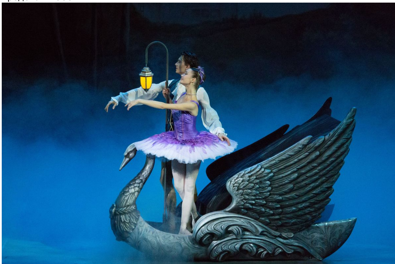
Сцена из спектакля "Спящая красавица"

Думаем, комментарии излишни. Жаль лишь, что, действительно, проект жизни удалось реализовать лишь к ее закату – Леонид Вениаминович руководил театром неполных семь лет, до самой смерти. После его ухода в 1976 году место художественного руководителя получил его последователь, премьер тогда еще Кировского театра Аскольд Макаров. Именно при нем в театре появились постановки зарубежных хореографов, масштабные классические полотна, пришла известность за пределами СССР.