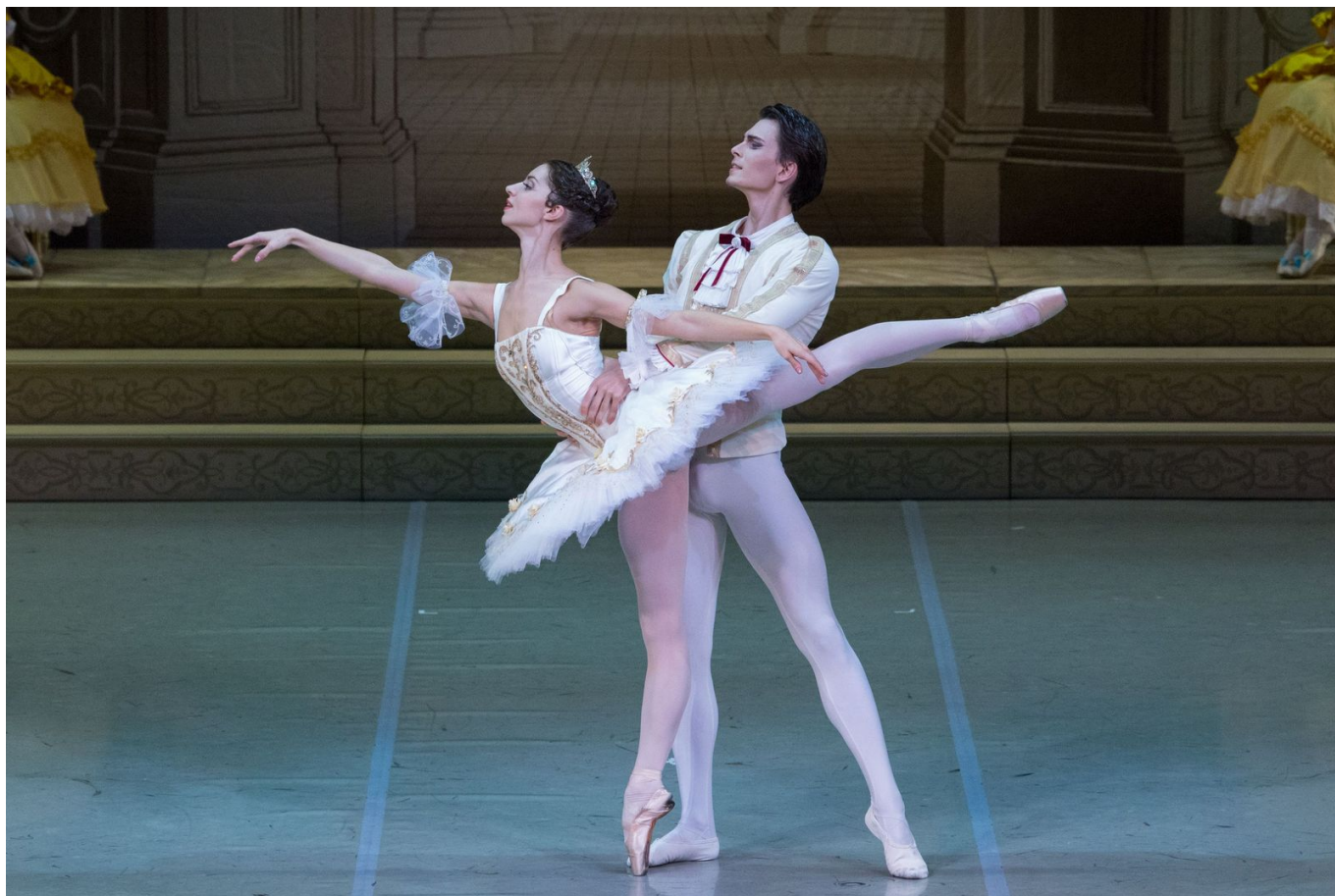
Сцена из спектакля "Спящая красавица"

Author: Надежда Сикорская, Genève - Женева , 18.06.2019.