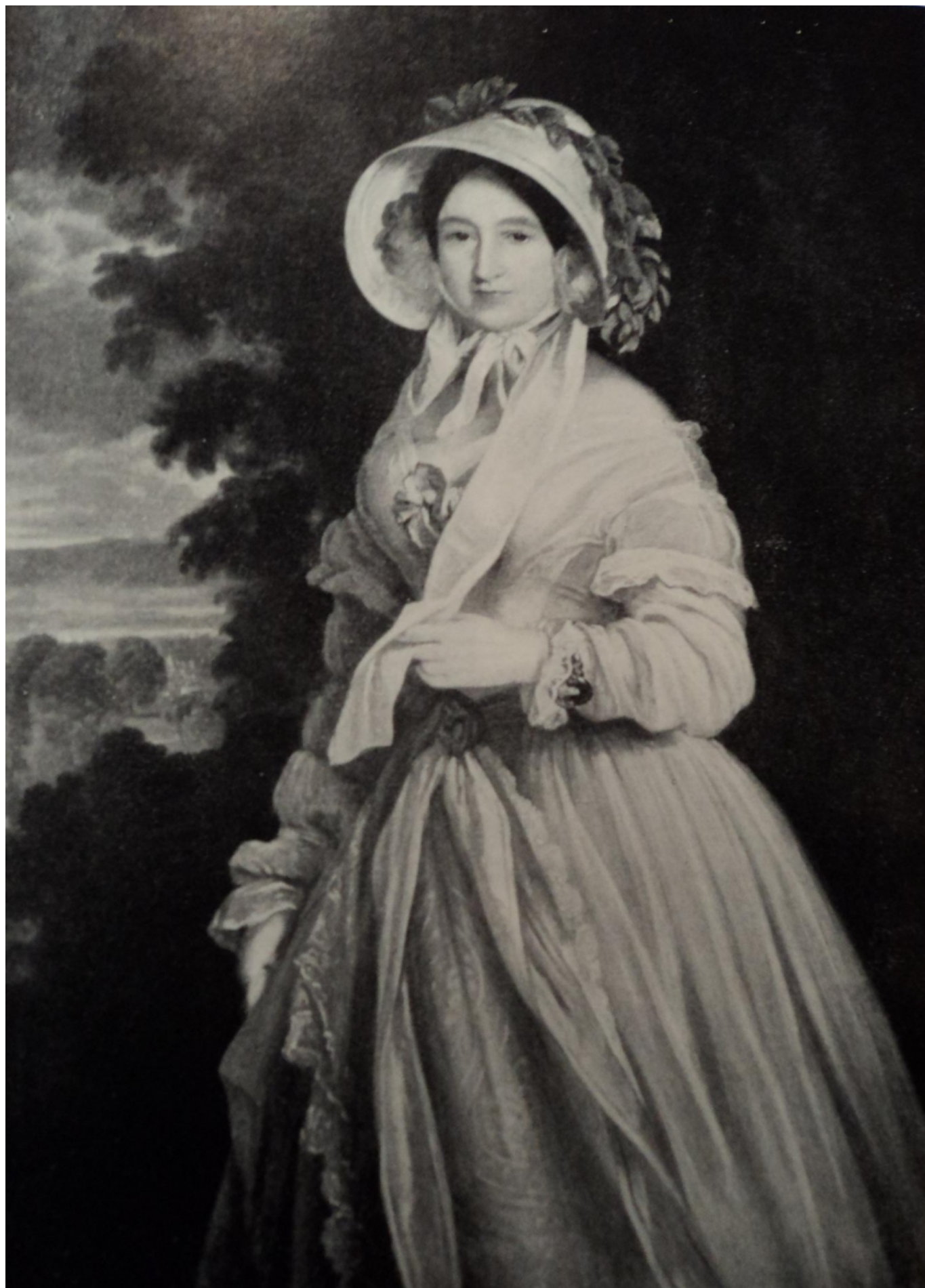
Великая княгиня Анна Феодоровна в Женеве. Холст, масло. Работа Франца Ксавера Винтерхальтера. Из книги Alville. La vie en Suisse de S.A.I. la Grande-duchesse Anna