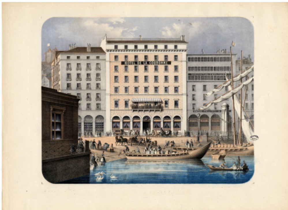
"Hôtel de la Couronne".

К православному исповеданию принадлежало по рождению большинство жителей Империи, а храмы, помимо всего прочего, регистрировали рождения, браки и смерти и были поэтому необходимы даже «состоящим под судом и не возвратившимся в отечество по требованию начальства» (подлинная цитата из одной женевской метрики 1866 года) прожжённым нигилистам-безбожникам. Регистрационный центр, место отправления русских традиций, салон встреч соотечественников или храм живой веры – чем бы ни были церковные институты для русских подданных, проживавших в середине XIX века на чужбине, архивы и воспоминания, связанные с церковной жизнью, были и остаются важнейшим источником для изучения повседневной жизни русских за границей, особенно в этот период.