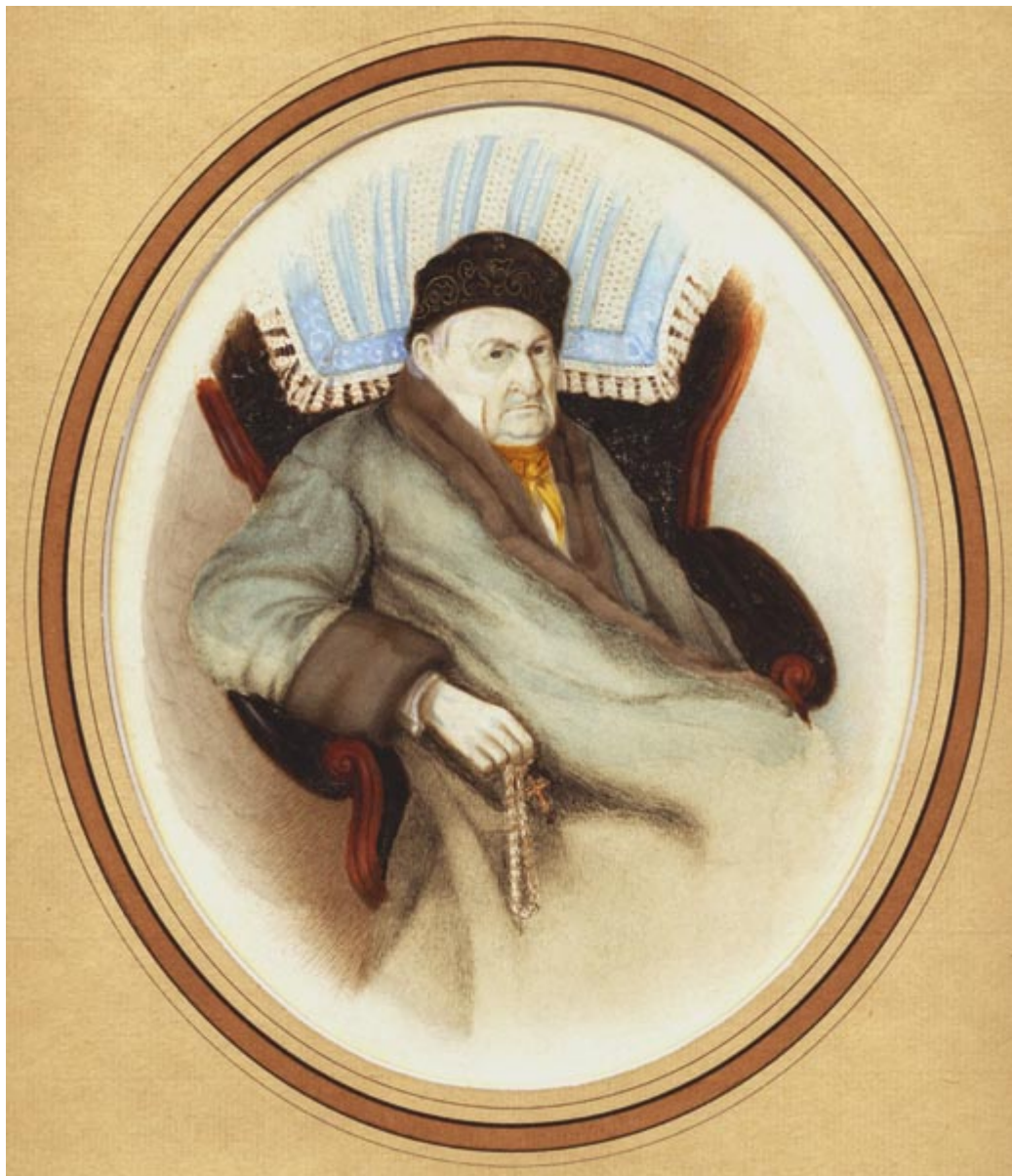
Портрет графа А.И.Остермана-Толстого в старости. Неизвестный художник. (ostermanniana.ru)

Но пока, на Пасху 1852 года, православные Женевы, русские и греки, числом до 27 человек, собирались в доньне существующем «Hôtel des Bergues» – «Гостинице Гор», как писалось в рапорте. В богослужении, так называемой службе Двенадцати Евангелий – чтениях о Страстях Христовых, часть прочитывалась по-славянски, часть по-гречески. В наше время в русских храмах Женевы и особенно Веве подобная «чересполосица» уже никого не удивит, но в 1852 году такое было в новинку, и священник оправдывался, почему «такая пестрота в богослужении могла быть допущена». Вообще, замечания священника 170-летней давности в отношении знания священнослужителями иностранных языков крайне актуальны в заграничных приходах и сейчас: «Когда я нахожусь на месте моего служения, мне истинно надобно иметь дар языков. Есть между православными, на моём духовном попечении находящимися, такие лица, которые не знают ни по-русски, ни по-гречески, а жена диакона нашей церкви, урождённая швейцарка, хотя и говорит по-французски, привыкла о предметах веры изъясняться на немецком языке...».