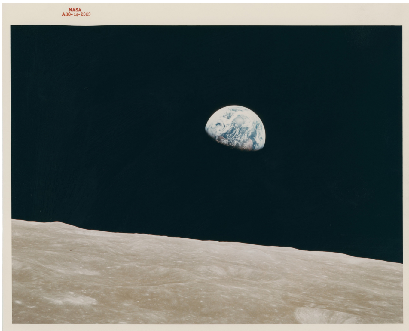
William Anders First Earthrise seen by human eyes, Apollo 8, 24 December 1968 Impression vintage chromogène sur papier Kodak à base de fibres, 20,3 x 25,4 cm Collection Victor Martin-Malburet, photo: NASA/Collection Victor Martin- Malburet, © William Ande