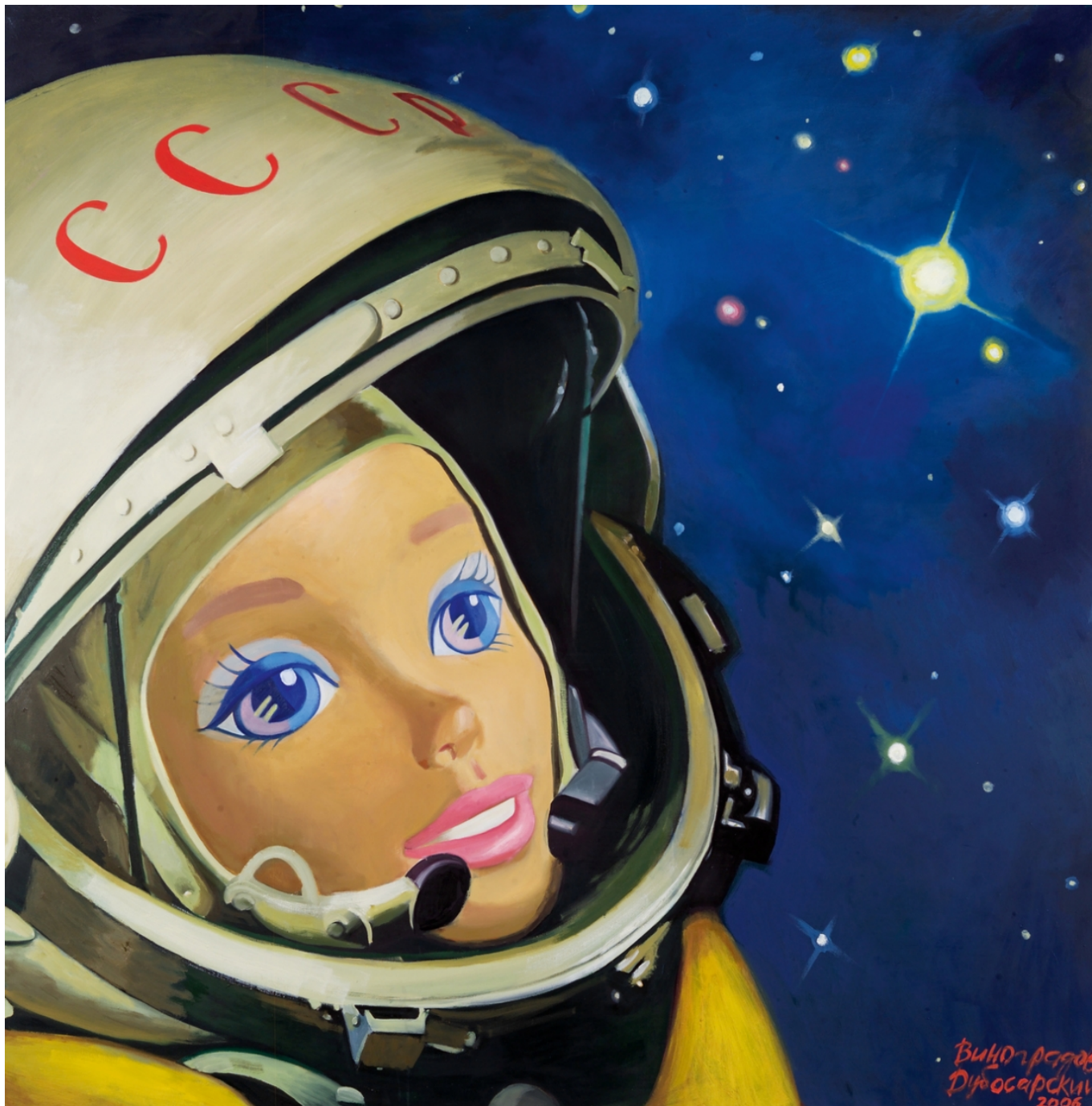
Vladimir Dubossarsky & Alexander Vinogradov Cosmonaute n°1, 2006 Huile sur toile, 195 x 195 cm Courtesy Vladimir Dobrovolsky © Vladimir Dubossarsky and Alexander Vinogradov