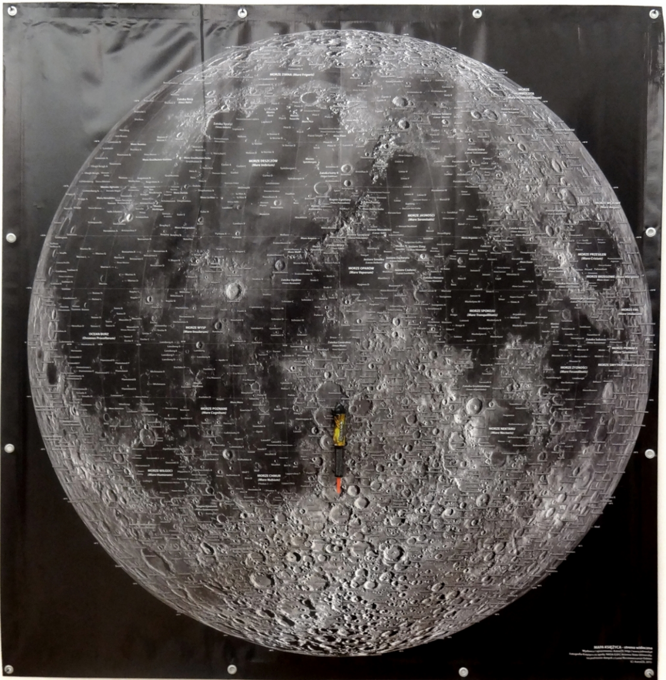
Roman Signer Vol lunaire, 2017 Technique mixte, 148 x 144 cm Collection Thomas Spielmann, Davos © Roman Signer

«От солнечного паруса в Берне до экзопланет». Доклад Вилли Бенца, руководителя миссии CHEOPS Европейского космического агентства, президента совета Европейской южной обсерватории, с последующей дискуссией. Четверг 23 мая 2019 года с 19.00 до 20.15. На немецком языке. Бесплатно для друзей музея и посетителей, приобретших билет на выставку. Билет CHF 10 / льготный билет CHF 8.