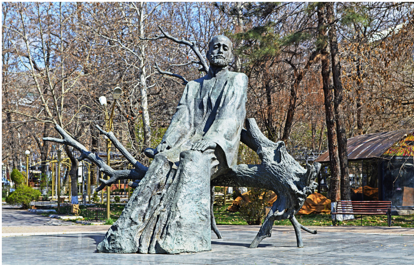
Памятник Комитасу в Ереване

Увы, история Комитаса лишний раз подтверждает, что нет пророков в своем отечестве. Стремление композитора к музыкальной педагогике не понравилось тогдашнему католику всех армян, решившему, что Комитас использовал церковную музыку для «неправильных целей». Музыкант на компромисс не пошел, отказался от титула рукоположенного епископа и в 1910 году уехал в Константинополь, где организовал смешанный хор из 300 человек, назвав его «Гусан». Мог ли он предполагать, что всего через несколько лет его в его жизни, как и в жизни всего армянского народа, произойдет трагедия?!