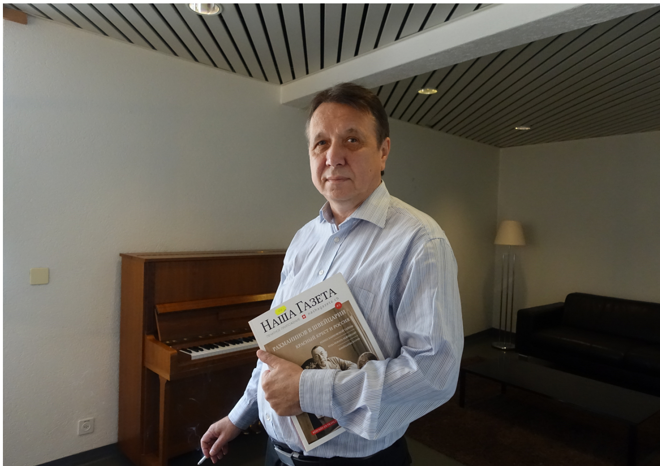
Михаил Плетнев в Монтре, 2016 г.