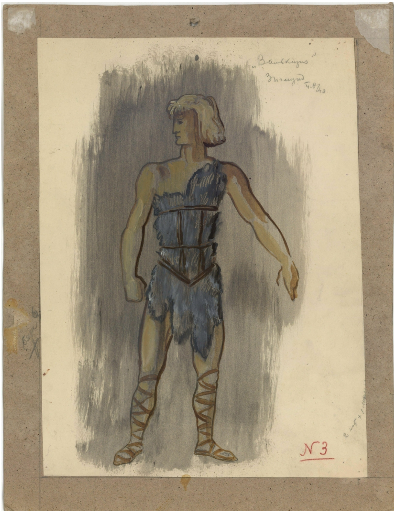
Эскиз костюма Зигмунда, автор - П. В. Вильямс

Эпохальным событием на этом фоне стала в 1940 году премьера «Валькирии», объявленная как начало осуществления постановки всей тетралогии в Большом театре. Статус сенсации придавало ей сразу несколько обстоятельств. Прежде всего,