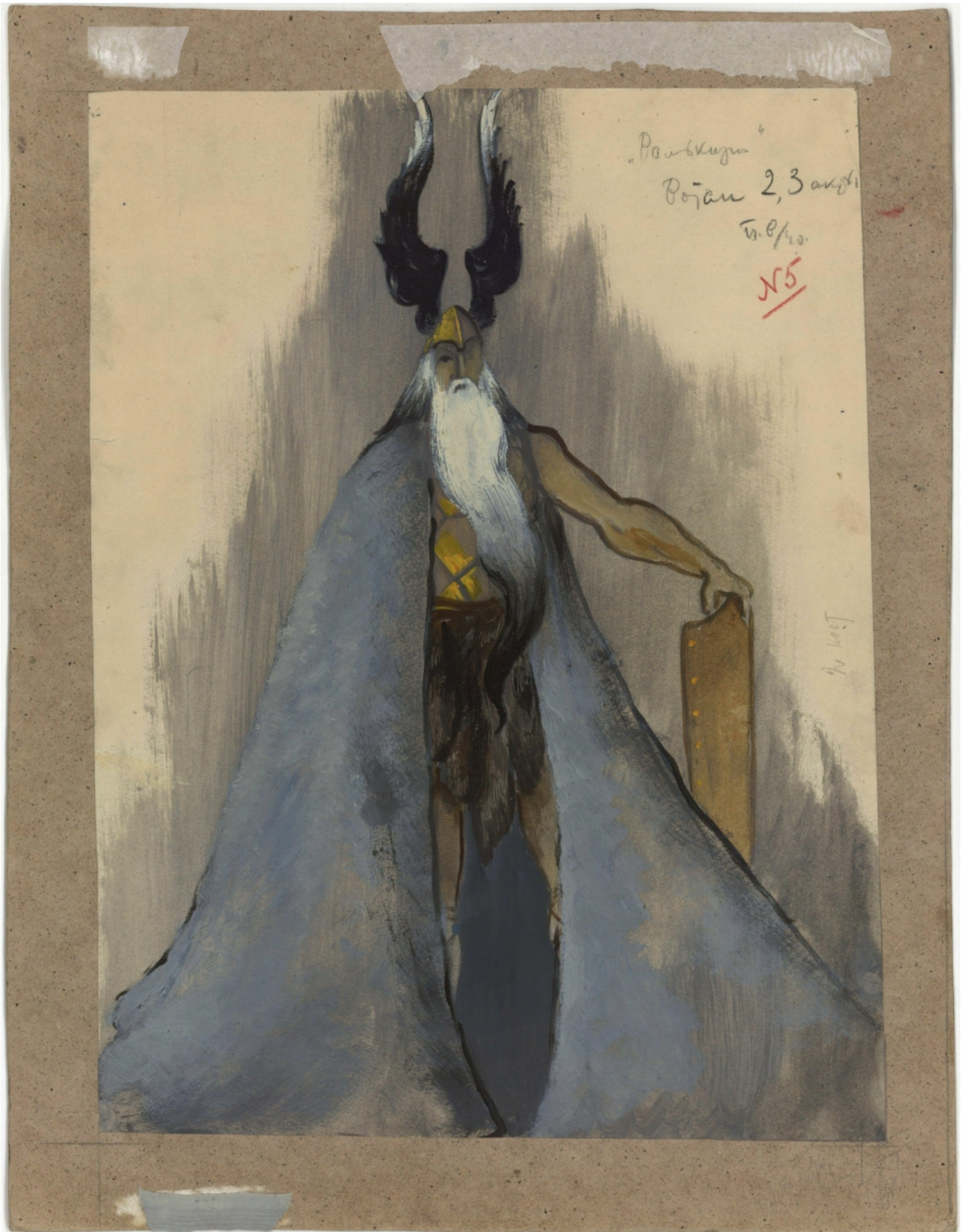
Эскиз костюма Вотана к 1 акту спектакля, автор - П. В. Вильямс (© Музей Большого театра России)

Большевики обратили благосклонное внимание на этого «сверхчеловека», созданного прямо по ницшеанскому образцу, даже невзирая на его востребованность