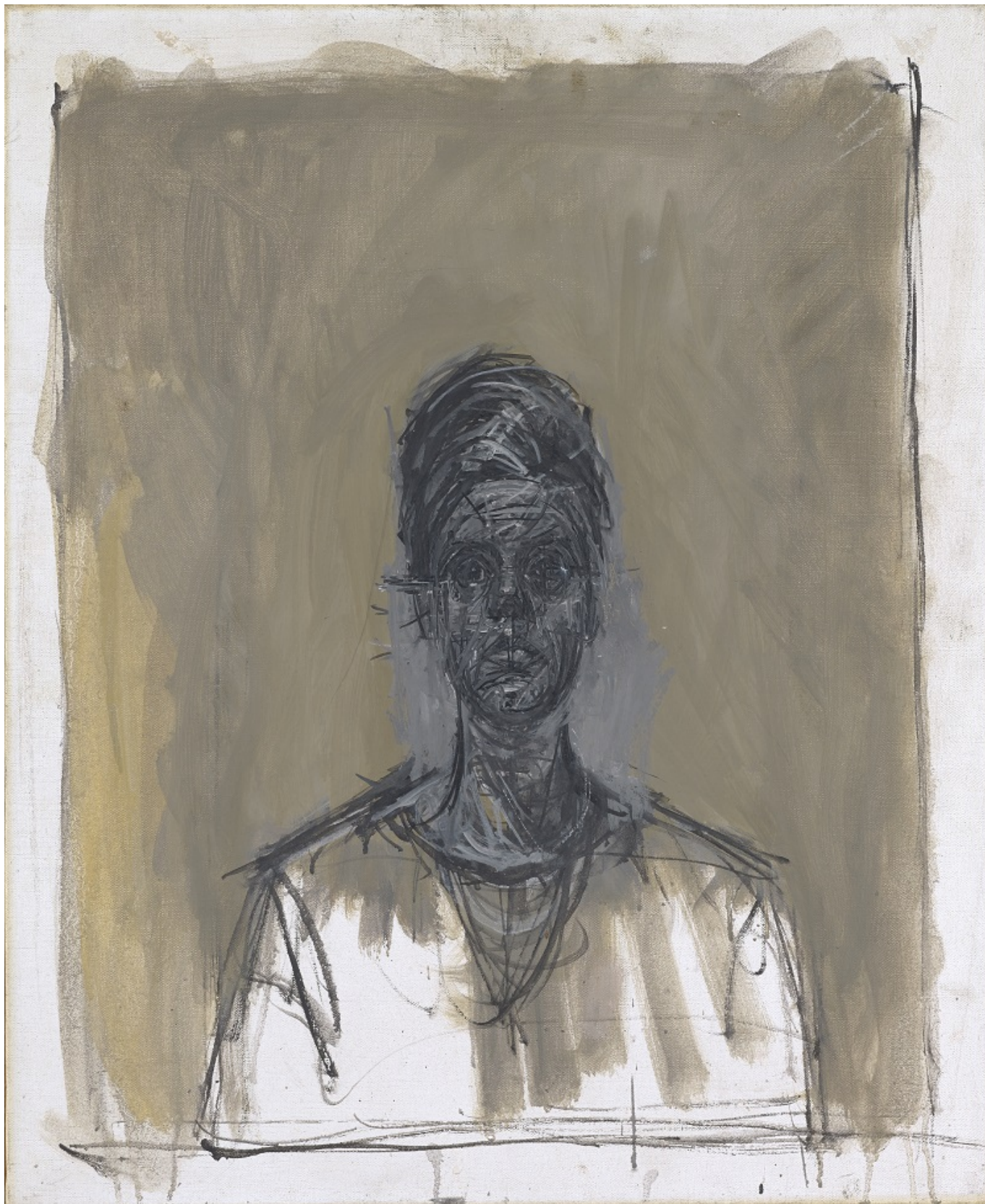
«Портрет Каролины», Альберто Джакометти, 1962 г.