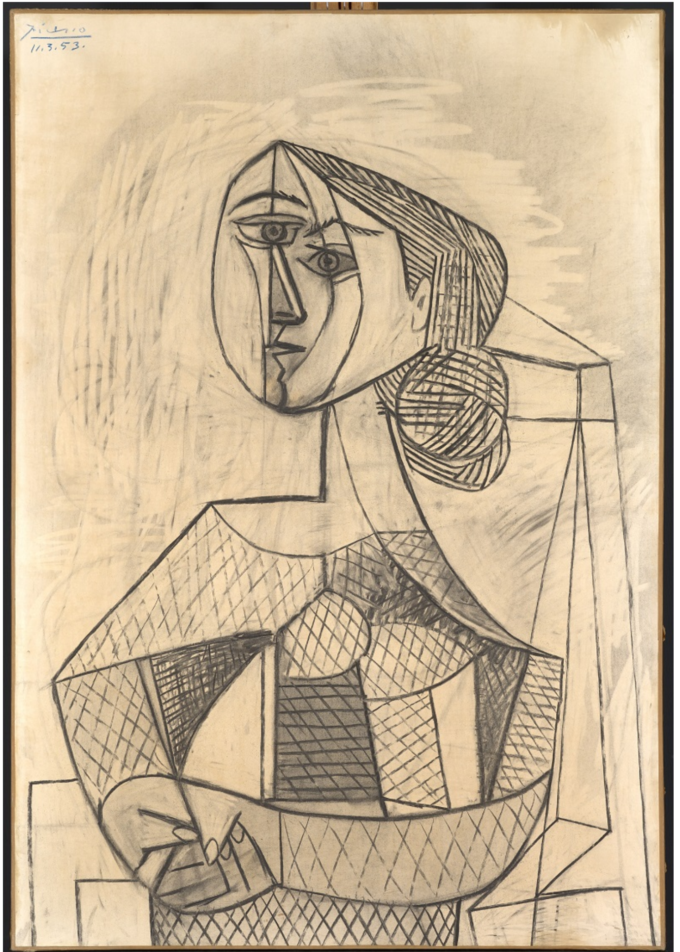
«Женщина в кресле», Пабло Пикассо, 1953 г.