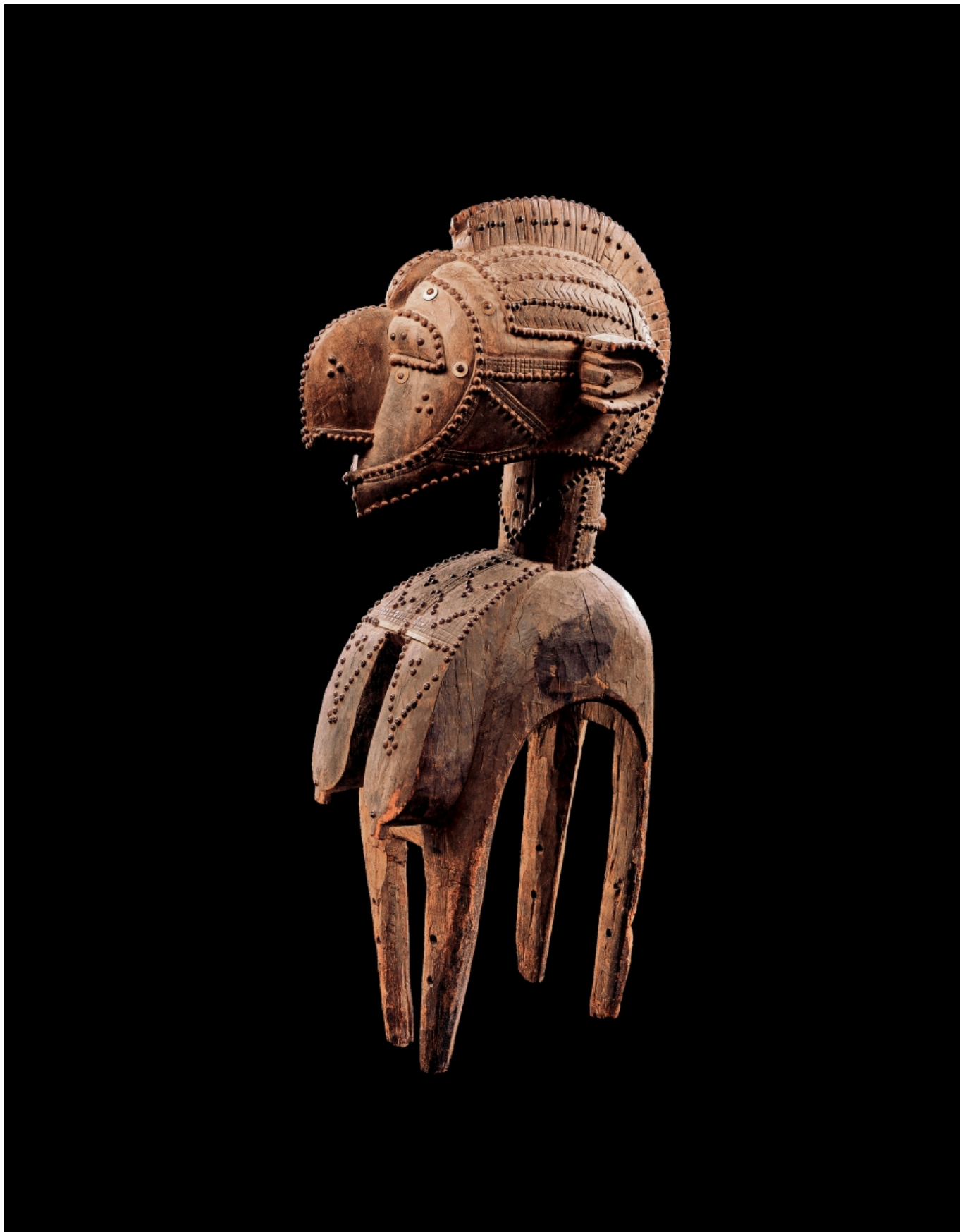
Заплечная маска имба гвинейской народности бага сделана в 19 веке из дерева, французских монет и обивных гвоздей (Musée Barbier-Mueller)

Среди более ранних, но нашумевших реституций стоит назвать возвращение, в 1930