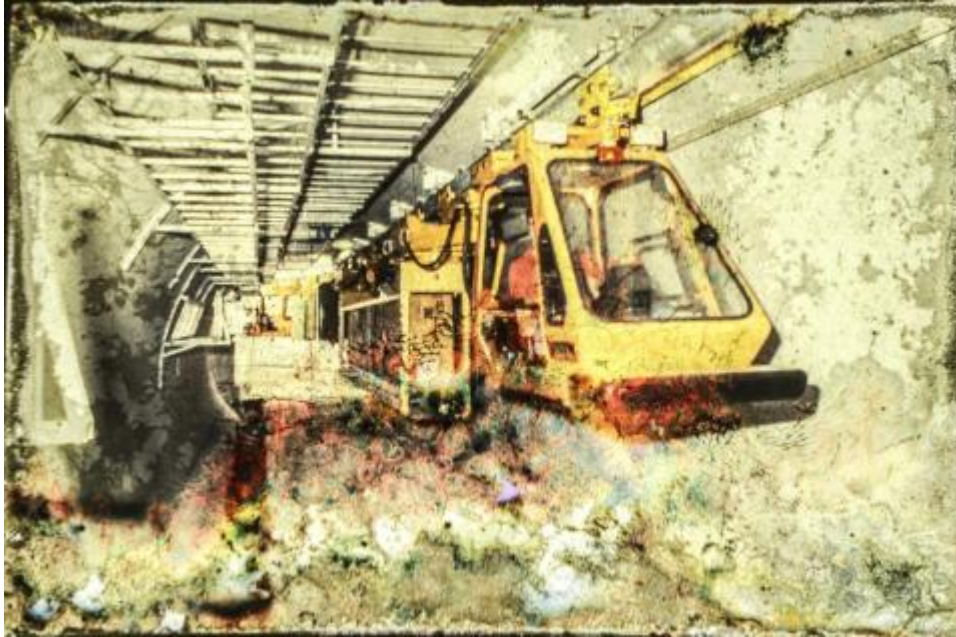
Звездная пыль

Проект, запущенный в 2016 году, называется по-французски «Mémoire digitale» («Цифровая память»). В его рамках физики решили перевести в цифровую форму 450 000 снимков. Около ста из них, сделанные в 1980-х годах во время строительства Большого электрон-позитронного коллайдера (LEP), были обнаружены в старом шкафу в одном из подземных хранилищ. Покрытые пылью и плесенью, они сильно пострадали под воздействием микроорганизмов: на них появились разноцветные пятна, напоминающие картины художников-абстракционистов.