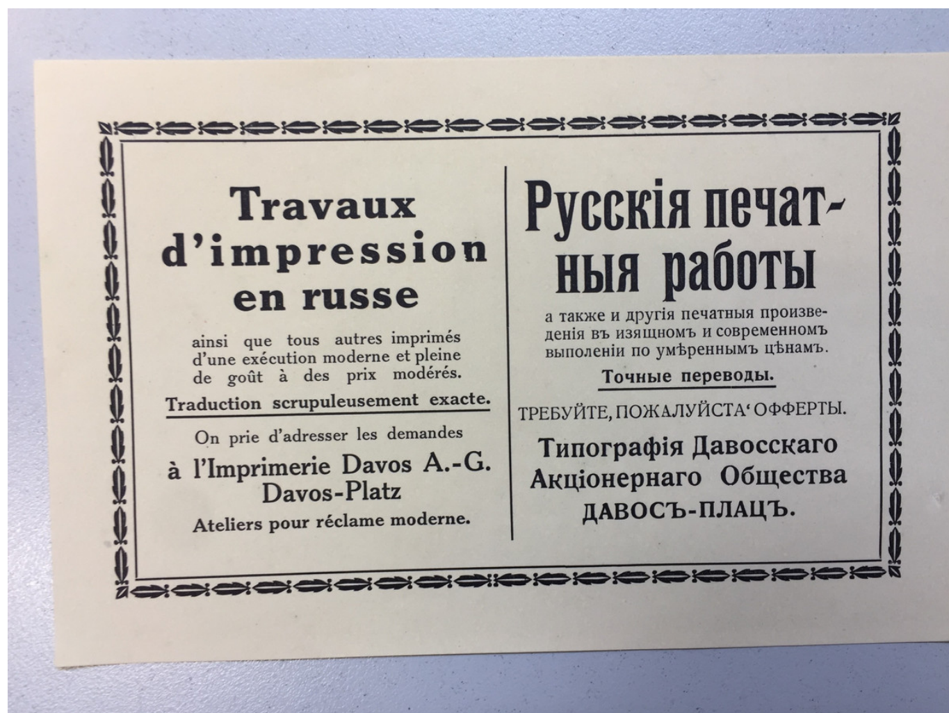
Рекламный листок Давосской типографии (примерно 1910-1912 гг.)

периодические сборники. В коллекции хранятся подшивки журналов «Нева», «Мир Божий», «Образование», «Вестник Европы», «Вестник иностранной литературы», «Жизнь», «Современные записки», «Дело». Есть литературные альманахи – «Сполохи», «Белые Ночи», «Аполлон», «Союз», «Литературно-художественный альманах издательства Прибой» и другие. Большой корпус составляют анонимные революционные брошюры того времени, например, «Социализация земли» (Одесса, 1906), «Царское правительство и рабочий народ» (Лондон, 1902). В Давосе с 1902 г. действовало и свое русское издательство, совмещенное с типографией. Название давосского издательства стоит на титульном листе на русском или на немецком языке, часто варьируется, например: «Издание акционерного общества давосской типографии», «Типография Давосскаго Акционернаго Общества», «Davoser russische Nachrichten» (рус. «Давосские русские новости»). В Давосе выходили и собственные периодические издания на русском языке: «За рубежом», «Давосский вестник», книжная серия «Свободная библиотека» (в некоторых вариантах – «Русская свободная библиотека»), а также книги другой тематики, например, «Путеводитель по Давосу» (Давос, 1911). Революция 1905 г. докатилась и до Давоса, здесь также начали печатать литературу пропагандистского характера, например, политическую сатиру «Царь Николай II, его среда и советники» (Давос, 1905).