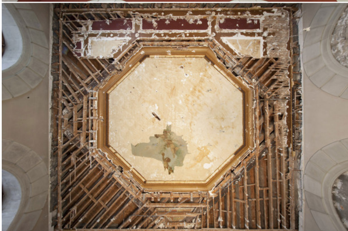
Одна из восстановленных фресок

Проблема реконструкции подобного здания заключается в том, что до многих его частей вообще нельзя дотрагиваться, поскольку они охраняются как архитектурное наследие. Однако на выдумку хитра не только голы, но и женевские архитекторы и электрики. Им удалось обойти исторические конструкции и улучшить изоляцию