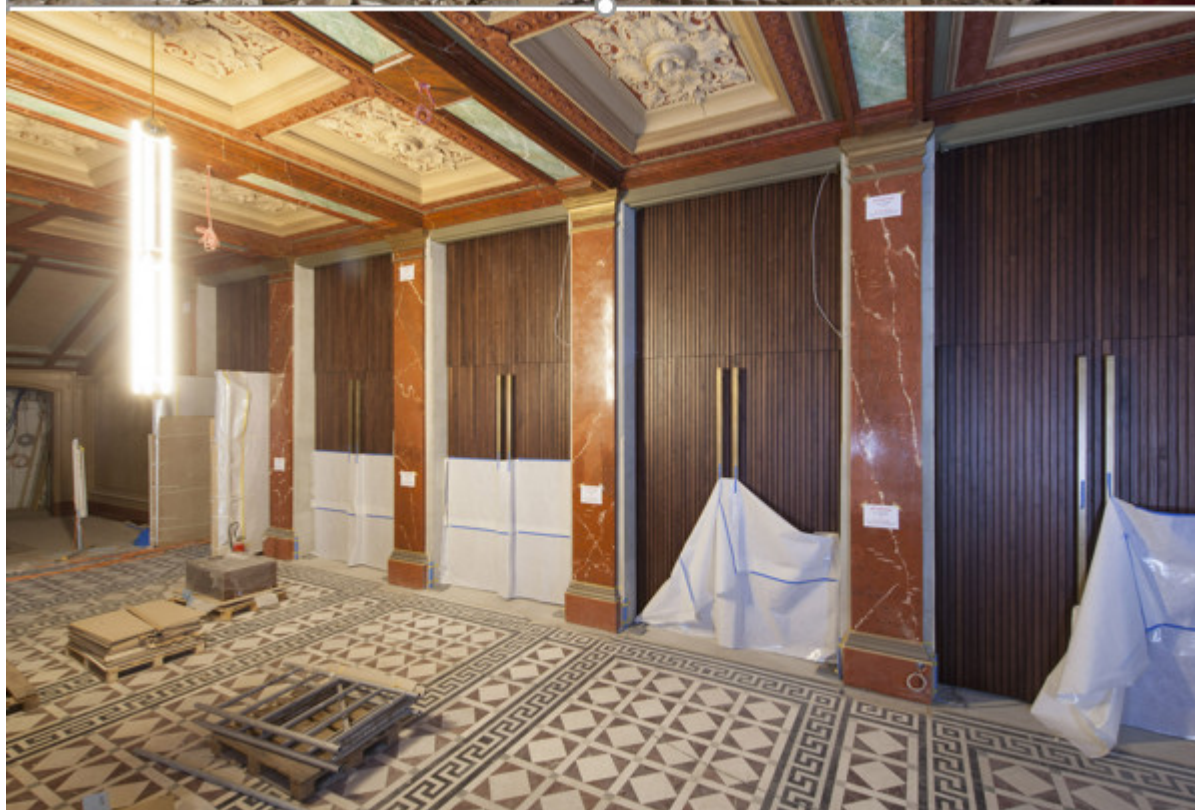
Фойе на первом этаже до и после ремонта