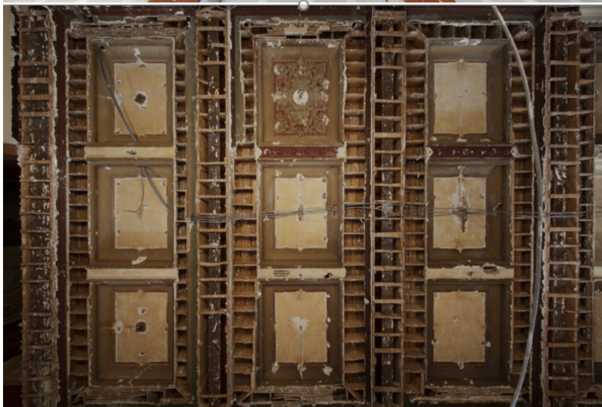
Потолок в нижнем фойе

А кто помнит стены цвета яичной скорлупы вдоль лестниц? Правильно, незачем их вспомнить, но обратите внимание на богатые новые цвета – зеленый, бордовый, золотой, подчеркивающие фрески художника Леона Го.