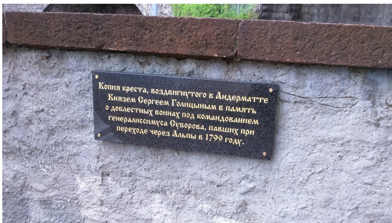
Памятная надпись на Суворовском кресте.

Заметим, что местные власти часто связывают все описываемые события по благоустройству не с осенним мини-юбилеем 2018 года, а с грядущим летом следующего, 2019-го, знаковым событием для города Веве и, пожалуй, всей Романдской Швейцарии – Праздником виноделов, который проводится здесь каждые 20–25 лет.