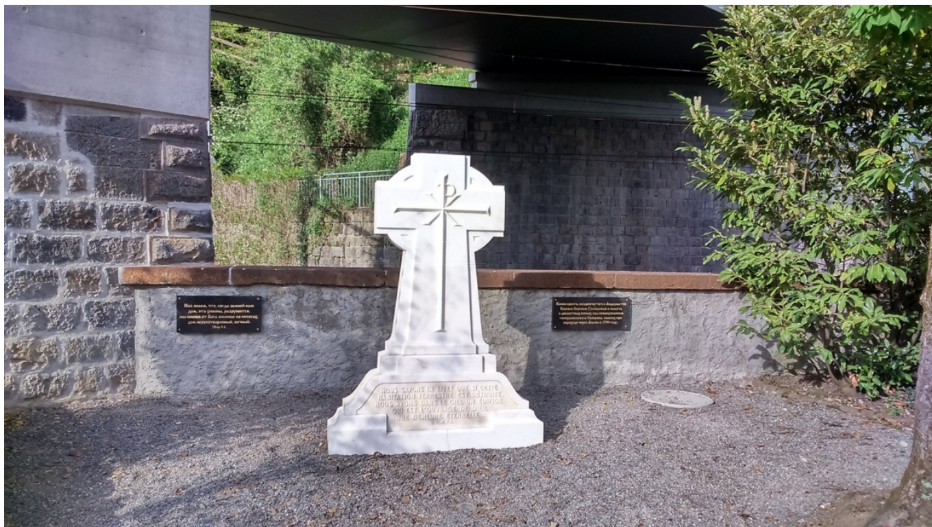
Суворовский крест во дворе храма.