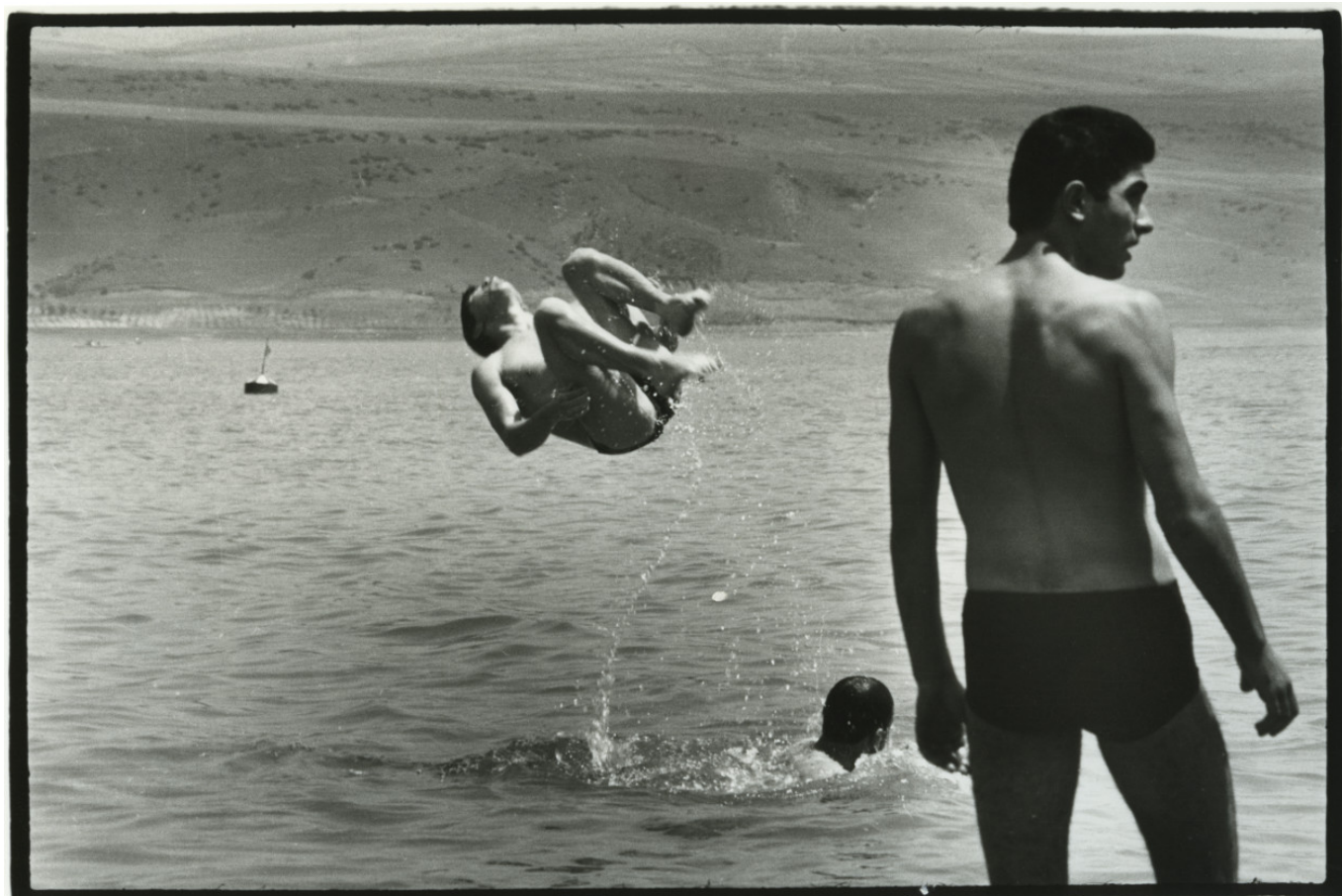
Жан Мор. 1966, Тбилиси, СССР

Author: Надежда Сикорская, Женева , 20.04.2018.