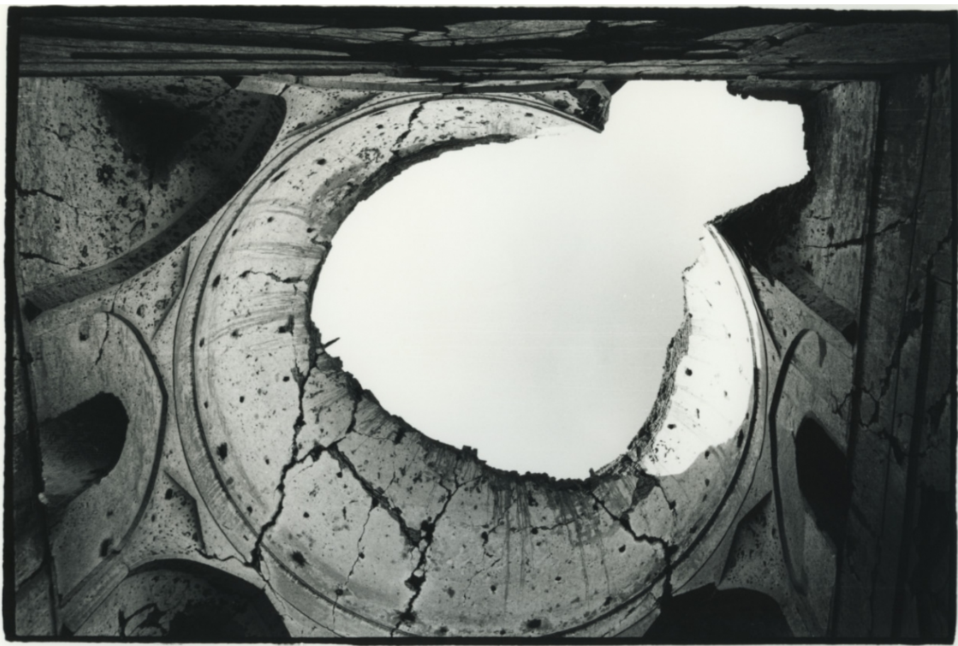
Жан Мор. Реставрируемая мечеть, Самарканд, Узбекистан, 1966 г. (© Jean Mohr, Musée de l'Élysée, Lausanne)

На выставке в Доме Тавеля представлены 250 снимков, в основном черно-белых, сделанных в разные годы и в разных странах и объединенных автором в 13 тематических групп. Нас привлекла фотография из Тбилиси, датированная 1966 годом, к которой автор предложил такую подпись: "Эта фотография могла бы сделана где угодно, но географическое положение - родина Сталина - придавала ей особую пикантность". А уже придя на выставку, мы увидели еще несколько интересных кадров из Москвы и Бухары.