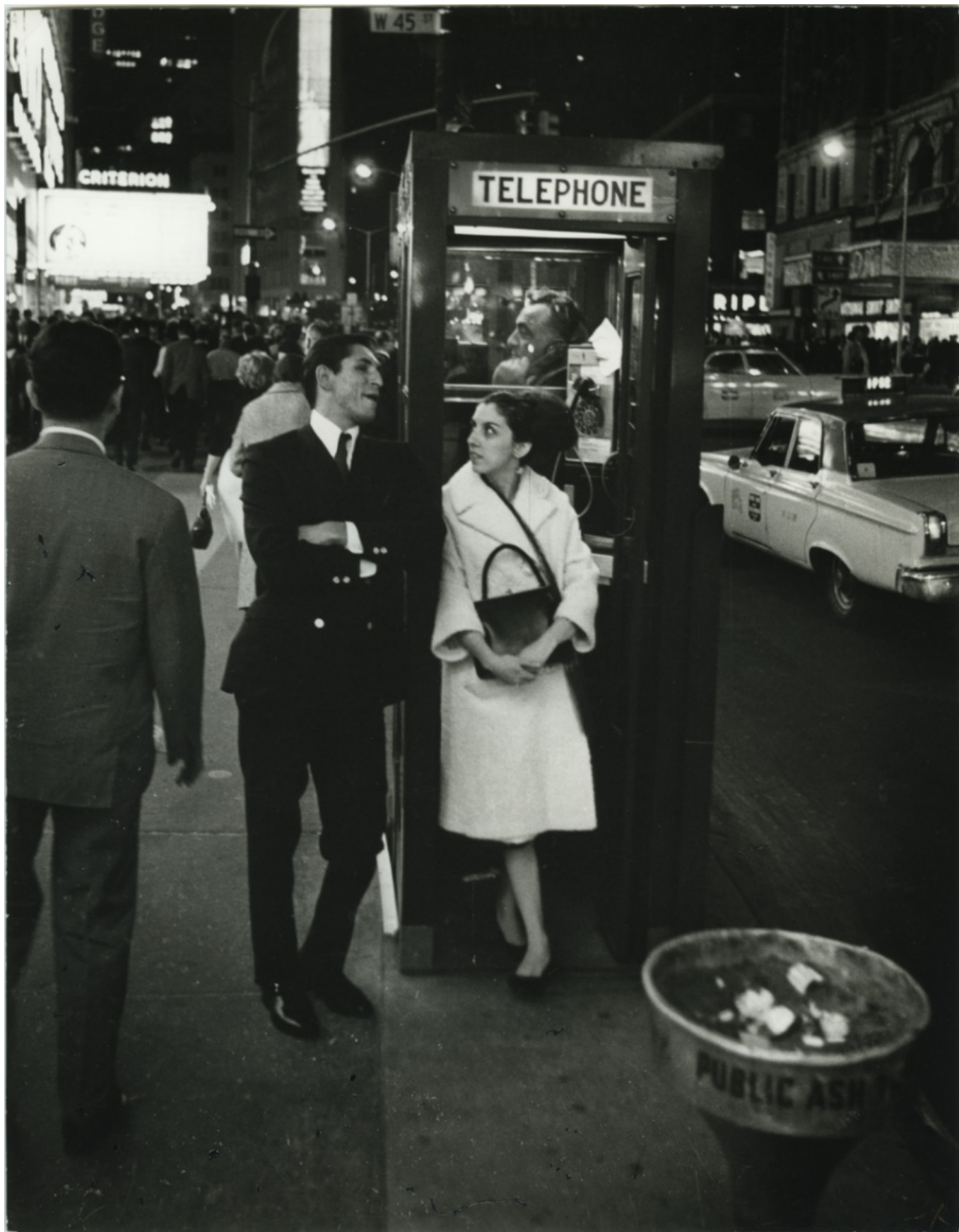
Жан Мор. Таймс Сквер, Нью-Йорк, США, 1966 г.

Вот в таком замечательном месте проходит сейчас выставка фотографа, которого тоже можно без преувеличения назвать женеvской достопримечательностью.