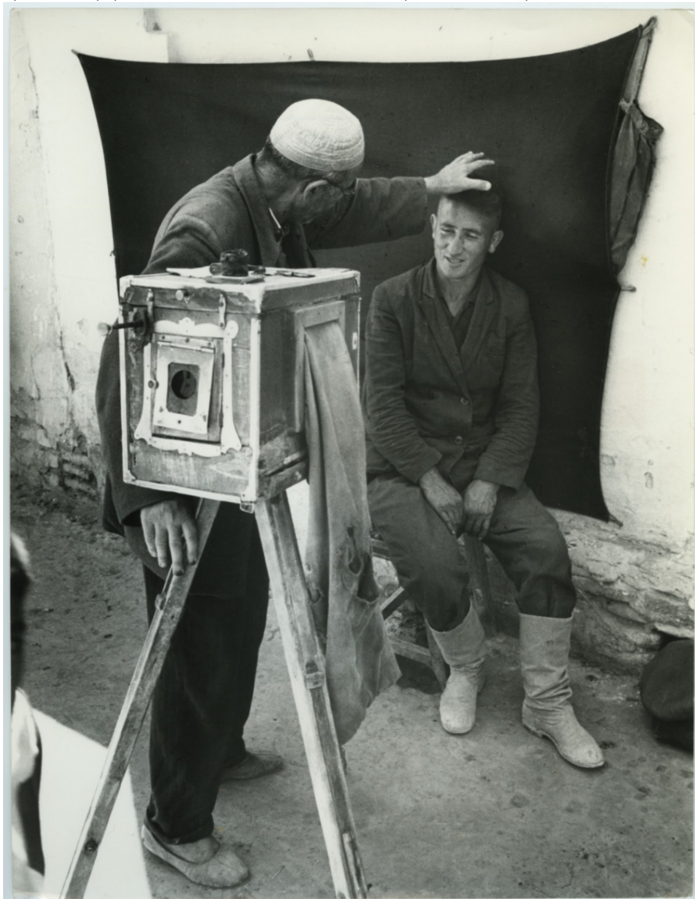
Жан Мор. Уличный фотограф, Бухара, Узбекистан, 1966 г.

куратор выставки Александр Фиетт. – Сдержанно, но мощно он дает возможность увидеть момент, схваченный лишь фотоаппаратом, придавая таким образом материальную форму невысказанному реальности. Получивший известность благодаря фотографиям, часто сопровождаемым эпитетом «гуманные», он также предается формальным исследованиям, дающим рождение абстракциям».