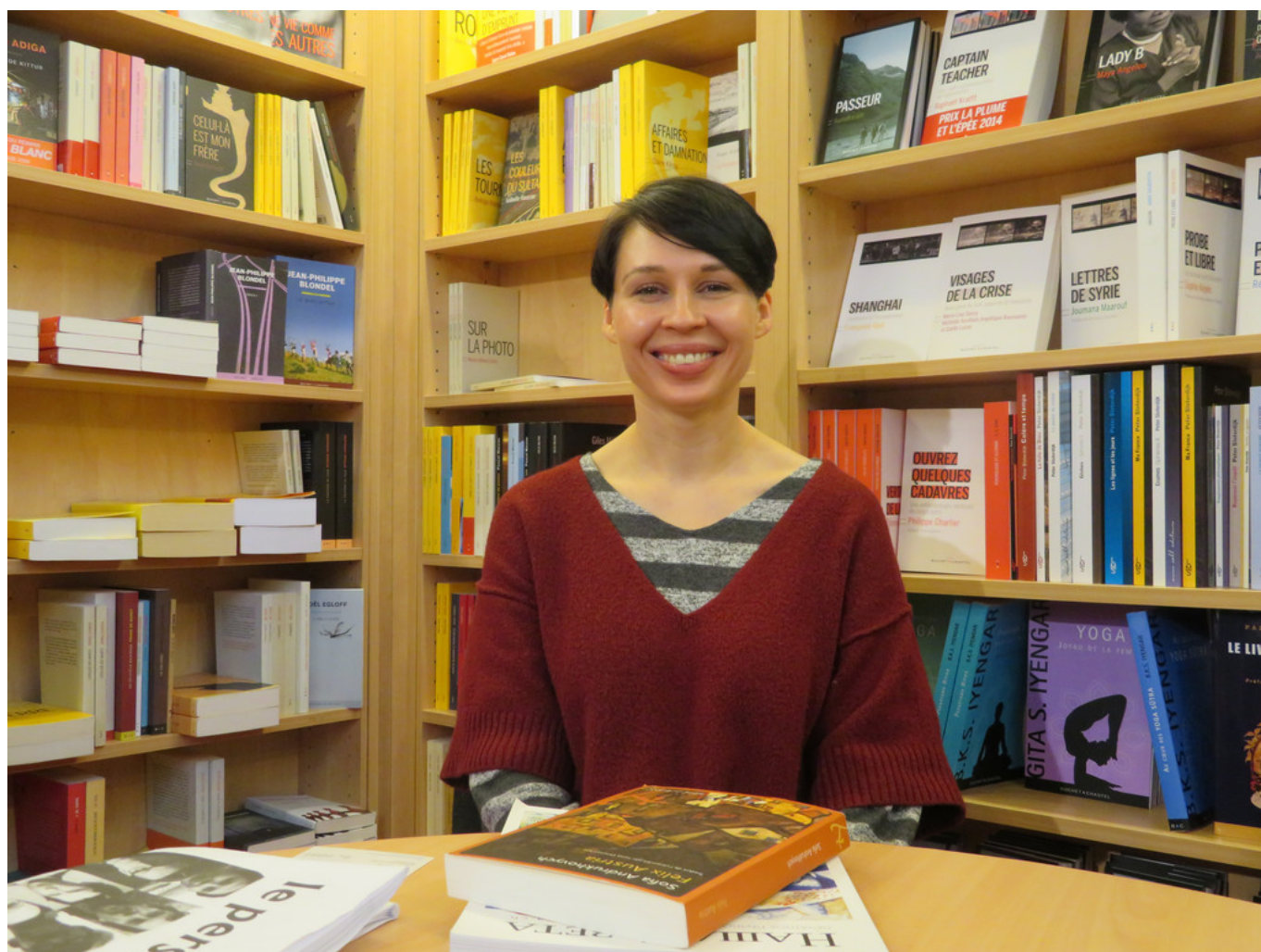
София Андрухович на Книжной ярмарке в Париже