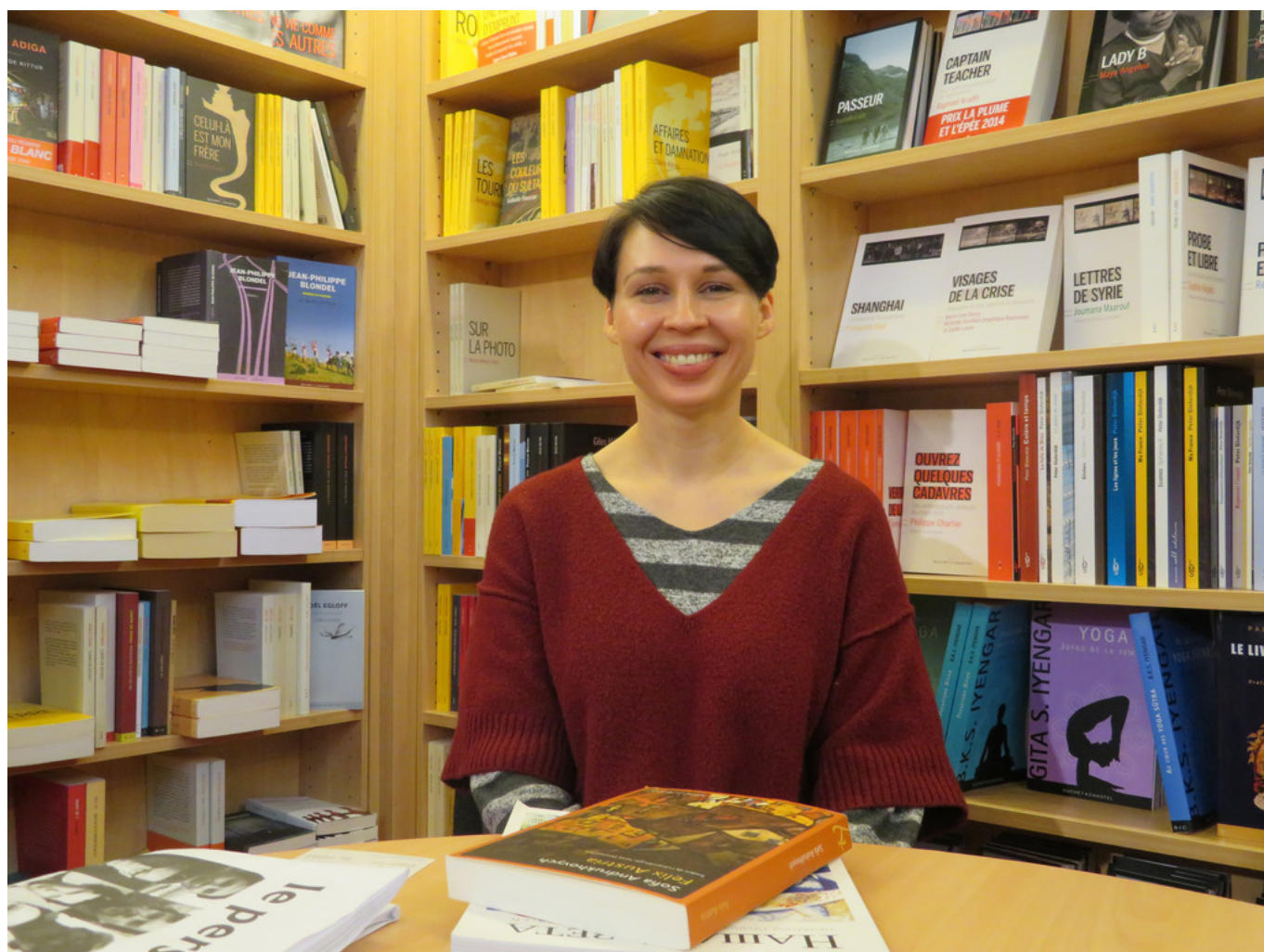
София Андрухович на Книжной ярмарке в Париже