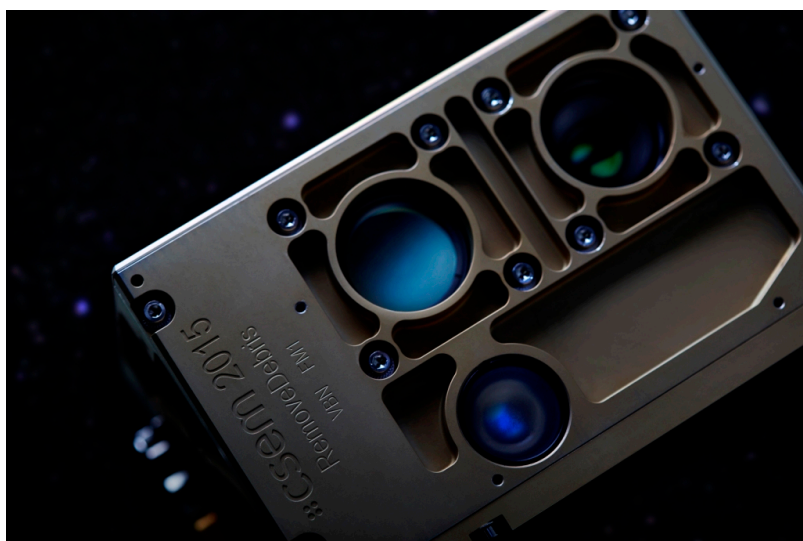
Система обнаружения, разработанная в CSEM (csem.ch)

Ученые намерены протестировать способы улавливания десятков тысяч космических обломков, используя сеть и гарпун. В этом случае большое значение имеет система наблюдения, которая позволит эффективно визуализировать цель. Спутник оснащен лидаром (активный дальномер) для получения 3D-изображений и цветной камерой. Система обнаружения была разработана специалистами CSEM в партнерстве с компанией Airbus и INRIA (Национальный институт исследований в области информатики и автоматизации, Франция). Работа ученых тем более актуальна, что обломки спутников и ракет, которые вращаются вокруг нашей планеты, могут повредить действующие аппараты.