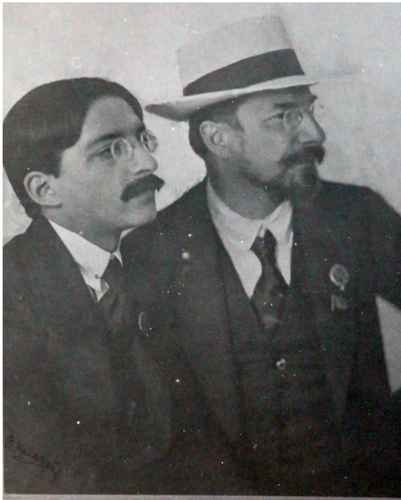
Суварин и Луначарский.