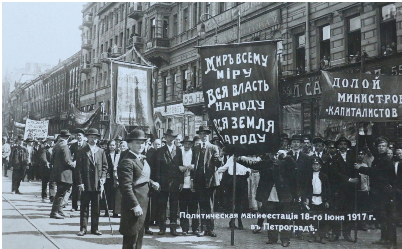
Политическая демонстрация в Петрограде 18 июня 1917 г.