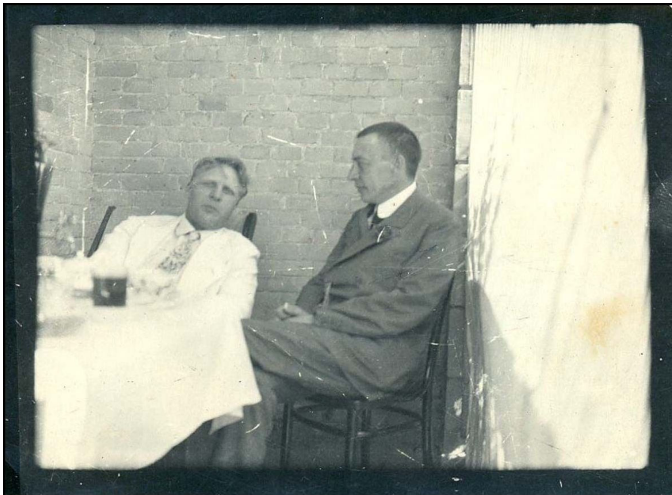
Ф. И. Шаляпин на даче у С. В. Рахманинова

Сергей Васильевич очень любил Швейцарию и в конце двадцатых годов задумал приобрести там дом, что и было осуществлено в начале тридцатых годов. Недалеко от Люцерна Рахманинов выстроил виллу, назвав ее «Сенар» ( по начальным буквам соего имени и имени жены, с прибавлением в конце начальной буквы своей фамилии). Он очень ее любил, нравилось бывать там и Шаляпину, который стал достаточно частым гостем у Рахманиновых. (О жизни С. В. Рахманинова Наша Газета уже рассказывала .)