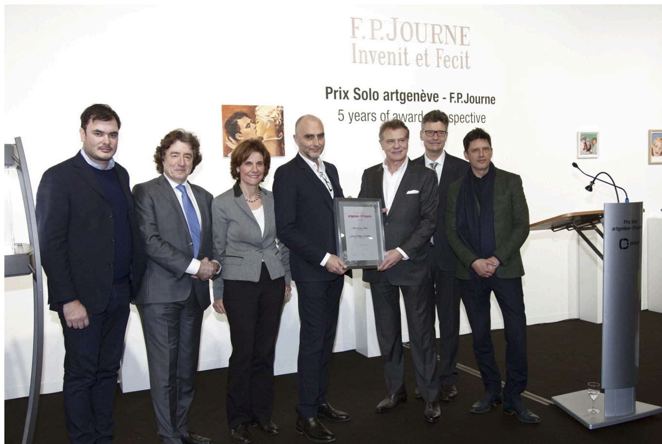
Ф. П. Журн с лауреатами и членами жюри

Author: Надежда Сикорская, Женева , 08.02.2018.