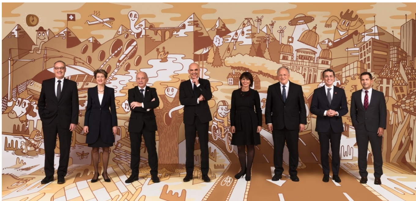
Портрет министров в прессе окрестили "веселыми похоронами"

Другое разочарование – это мужские костюмы. Переодеть хочется практически каждого: одному пиджак широк в плечах, у другого еле-еле сходится на груди, у третьего слишком короткие брюки, четвертому нужно укоротить рукава, пятому не мешало бы научиться пользоваться утюгом, и почти всем нужно расстегнуть нижнюю пуговицу пиджака.