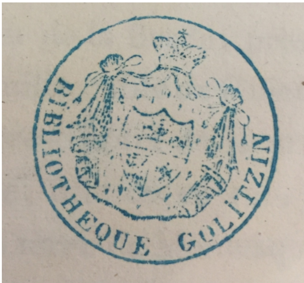
Штамп библиотеки князя Голицына (HdV Piguet)

И наконец, еще три лота, непосредственно связанных с Россией. «Физическая, моральная, гражданская и политическая история древней и современной России» Николая-Габриэля Ле Клерка в шести томах, выпущенная в 1783-1794 годах и содержащая 6 портретов-гравюр и медаль (лот 16). «История России» Левека, Мальт-Брюна и Деппинга, в которой собраны также описания основных населявших империю народностей. Это восьмитомное издание 1812 года содержит 61 портрет русских правителей и других деятелей и большую карту России той эпохи (лот 17). Есть и издание на английском языке. В 1800 году Уильям Тук предложил миру свой «Взгляд на Российскую империю в царствование Екатерины Второй и до конца нынешнего века». Размышления господина Тука растянулись на три прекрасно сохранившихся тома (лот 18).