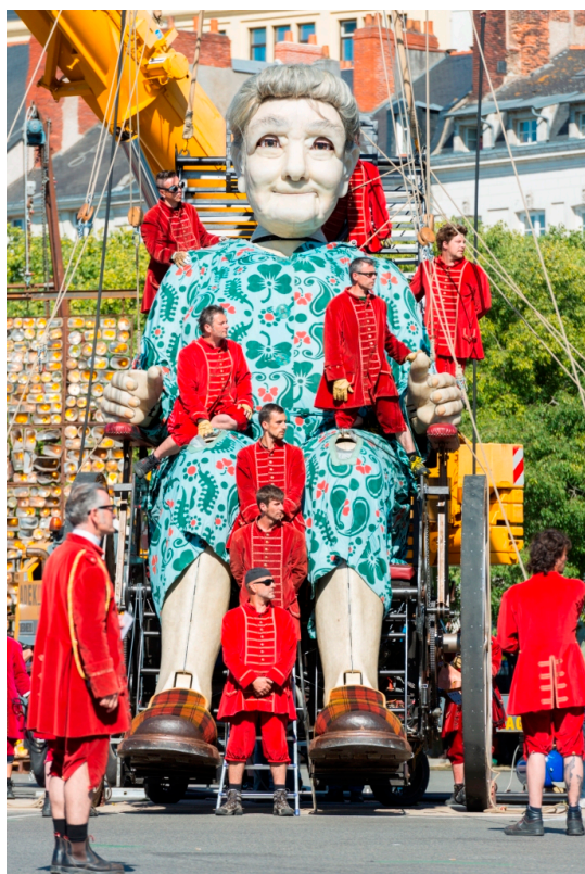
Бабушка и ее лилипуты ( lesgeants-geneve.ch )

Лицо статуи – из силикона, волосы и брови – из конских волос. Один только ее шиньон весит 12 килограмм. Вес Бабушки – 1 787 килограмм. В движение ее приводят 25 «лилипотов» в бордовых одеждах. В таком возрасте и при таком весе ходить старушке нелегко: за час она преодолевает 1,2 километра. Если же она сядет в любимое кресло-каталку весом 5 тонн, то за то же время может проехать 3 километра, отмечается на сайте будущего представления.