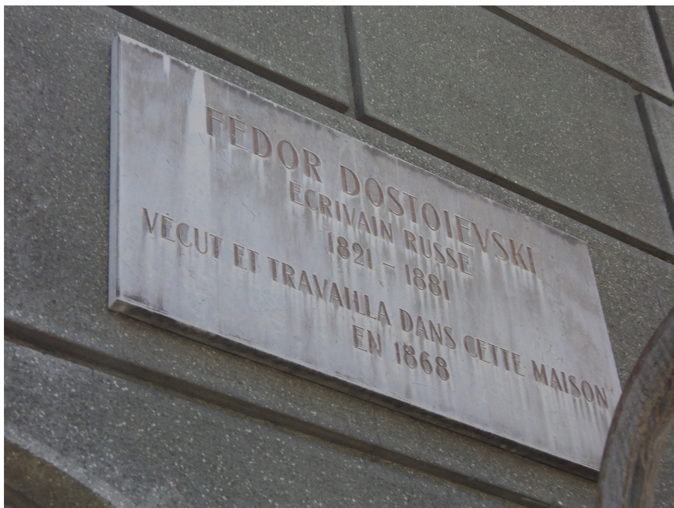
Мемориальная доска на доме Достоевского. (I. Grézine/Nashagazeta.ch)

Author: Иван Грезин, Ве́ве , 05.07.2017.