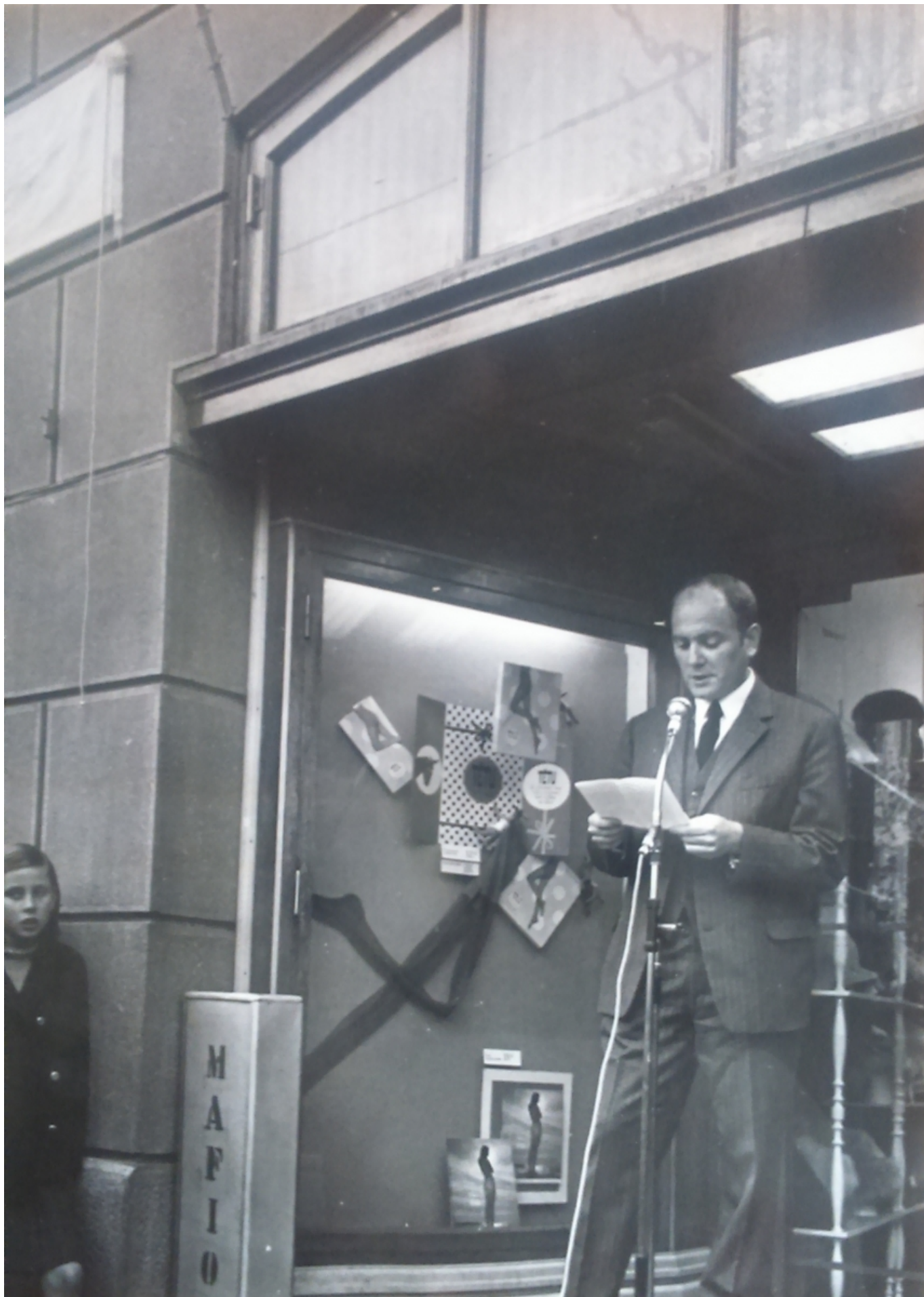
Клод Буржуа выступает на открытии мемориальной доски, 31 октября 1968 г. Musée de Vevey.