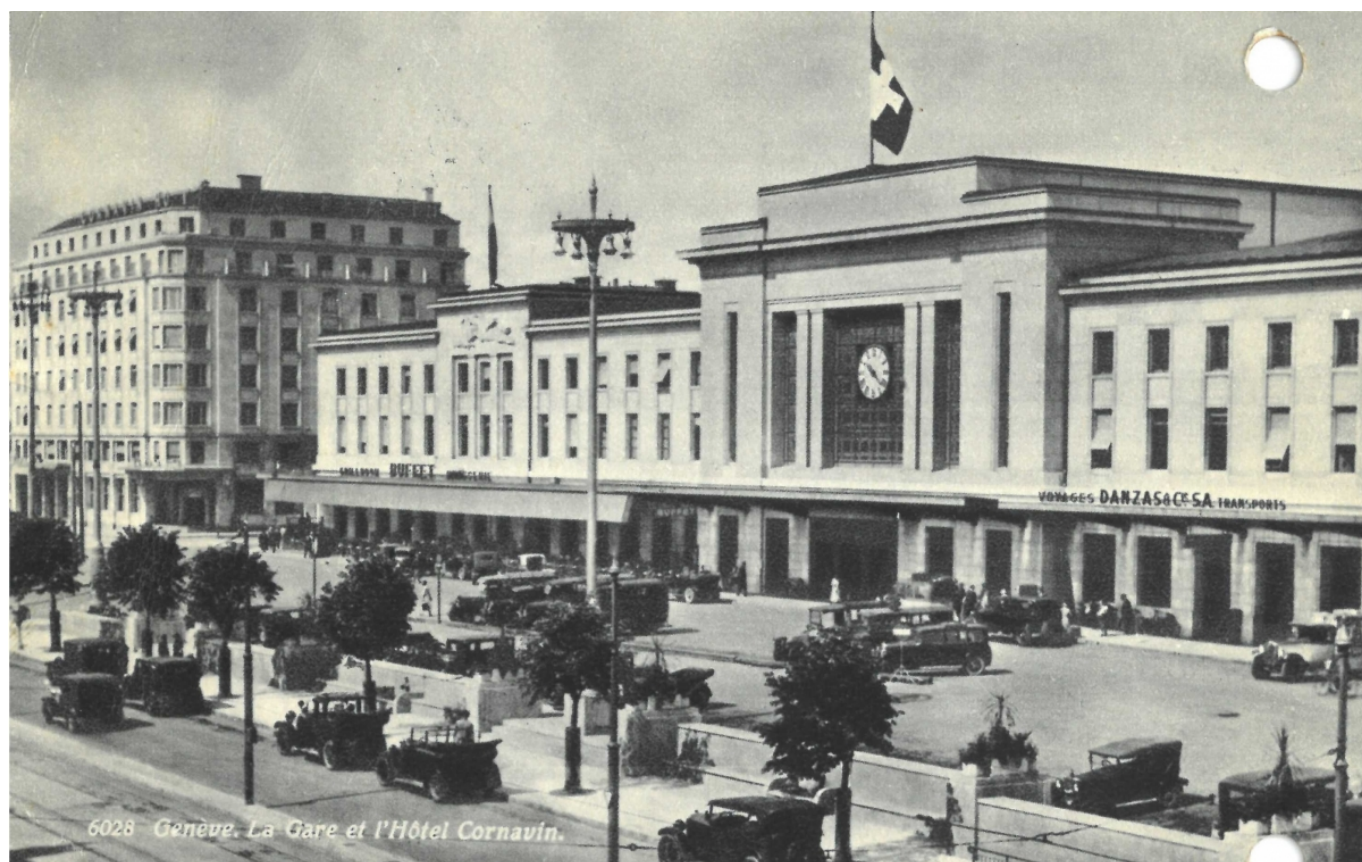
Вокзал Корнавэн и одноимённый отель. Почтовая открытка. Не ранее 1934 г.

Там, друг против друга, висят две карты-фрески. Если стоять спиной к привокзальной площади, справа окажется карта Швейцарии, а слева – карта Европы. На обеих – место размещения и прямой заказчик в лице Швейцарских железных дорог обязывают – как гимн стальным магистралям обозначены основные железнодорожные пути соответственно и страны, и континента.