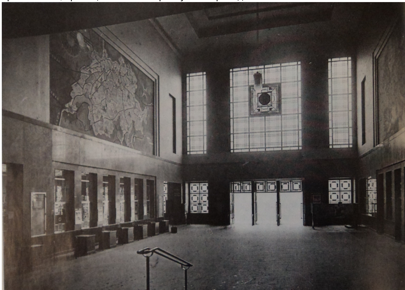
Центральный вестибюль вокзала вскоре после постройки.

Почему же на карте такие странные границы? Судя по всему, «виновато» оказалось просто не очень хорошее знание художником европейской периферии. Или в атласе, которым он пользовался как пособием, нужных карт не оказалось. То, что Советский Союз изображён не единым целым, а разделён на республики – политико-географическая данность. На всех картах, изданных во всём мире, если это требовалось, границы Советских республик проводились.