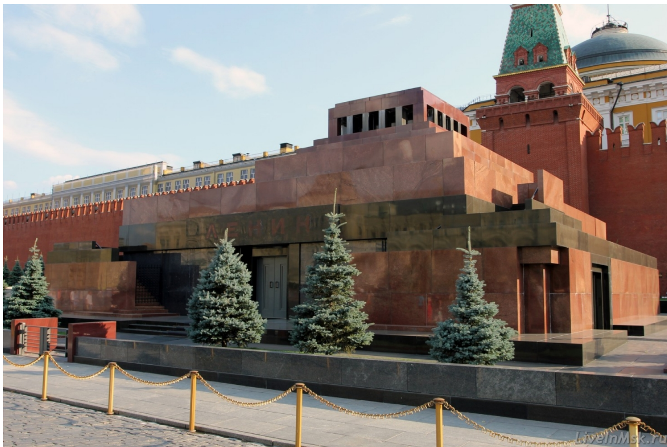
Место действия романа