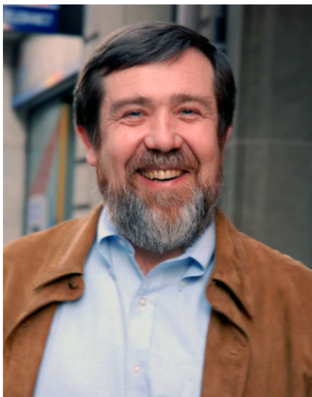
Алексей Пажитнов – создатель игры «Тетрис»