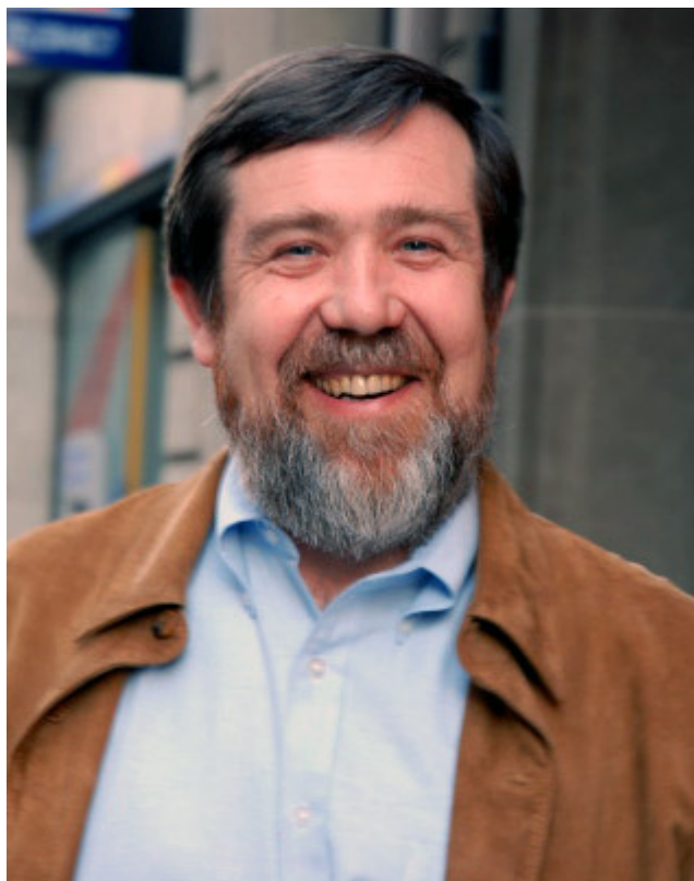
Алексей Пажитнов – создатель игры «Тетрис»