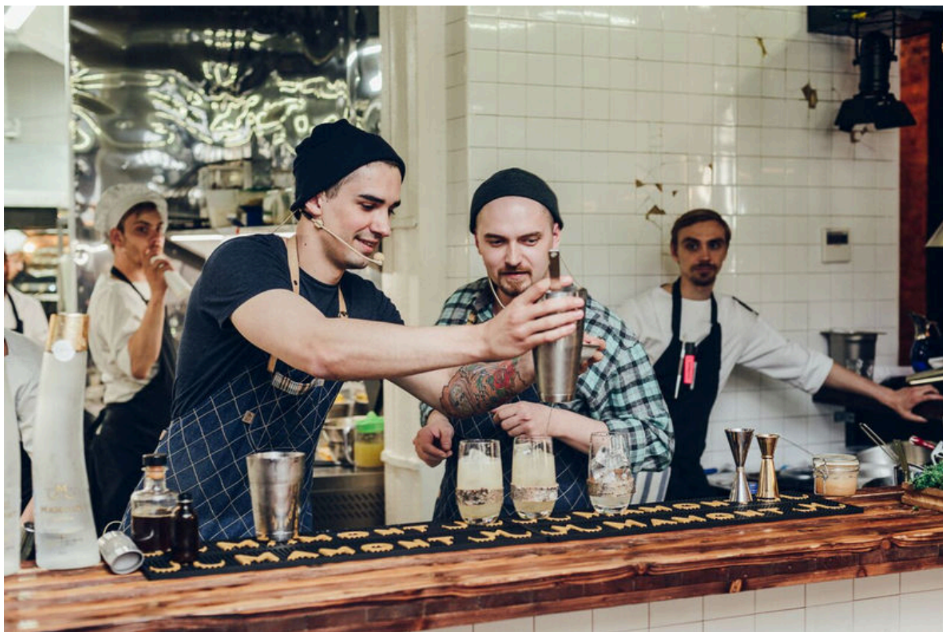
Команда Barrel Team за работой