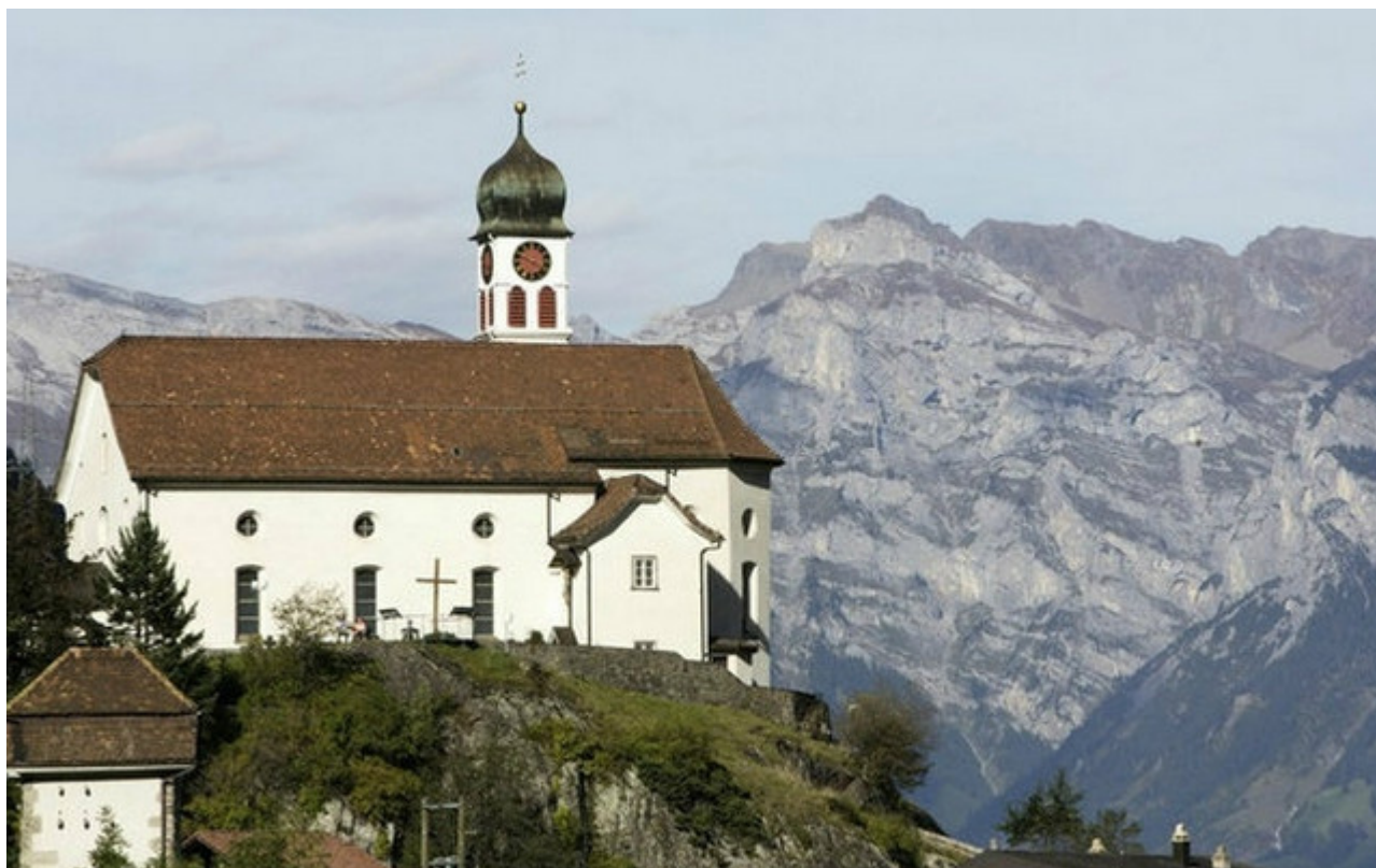
Церковь Вассен

поднимаемся с 440 до 1100 метров, прежде чем нырнуть у Гешенена в 15-километровый туннель», – пишет газета Le Matin. Внутри этой галереи, принявшей первые поезда еще в 1882 году, теперь можно лицезреть сцены из истории региона и мифы Сен-Готарда. Кстати, линия, состоящая из двух сотен мостов и семи винтообразных туннелей, привлекала путешественников всего мира с первого дня своего существования.