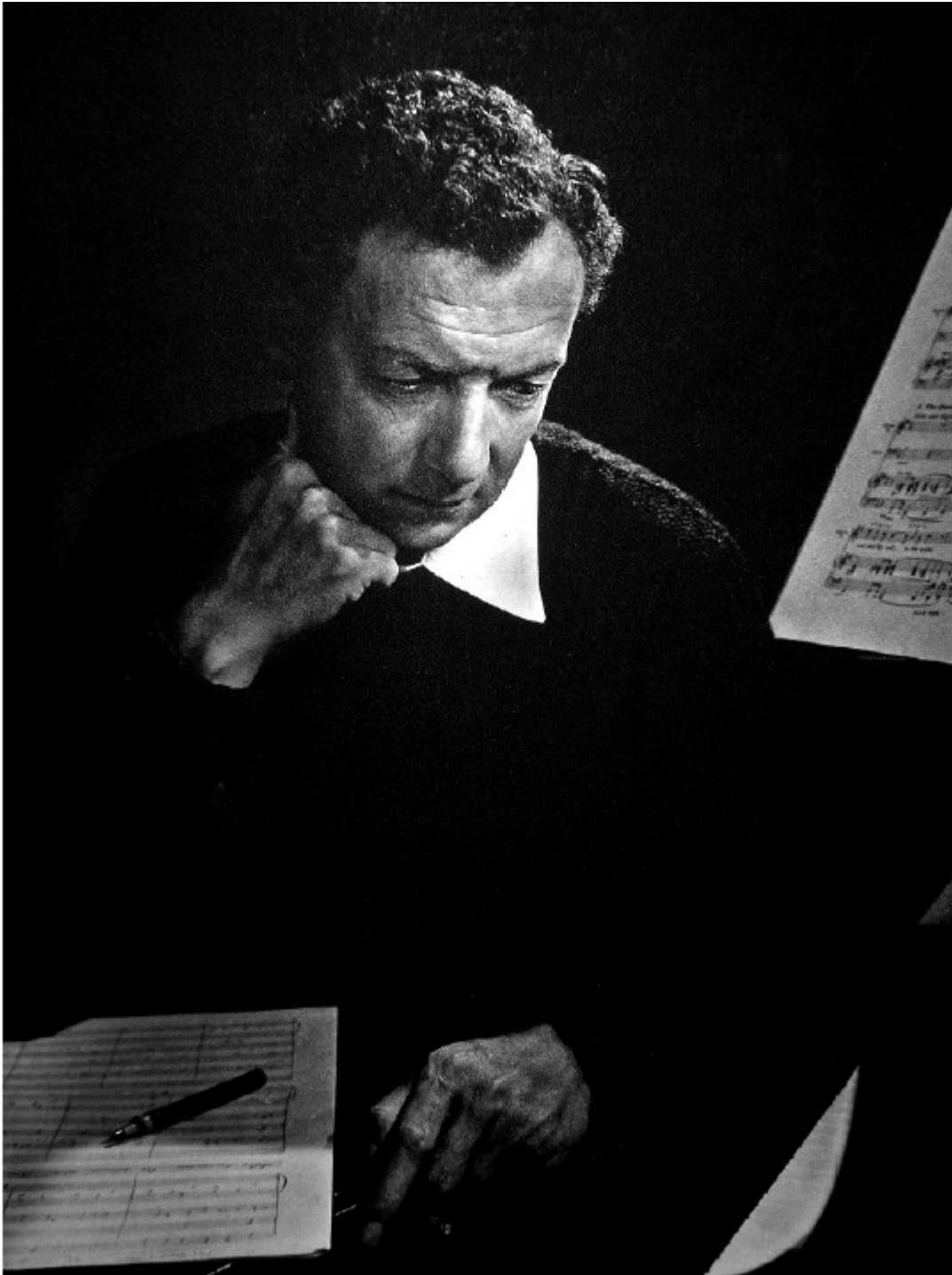
Бенджамин Бриттен (1913-1976)