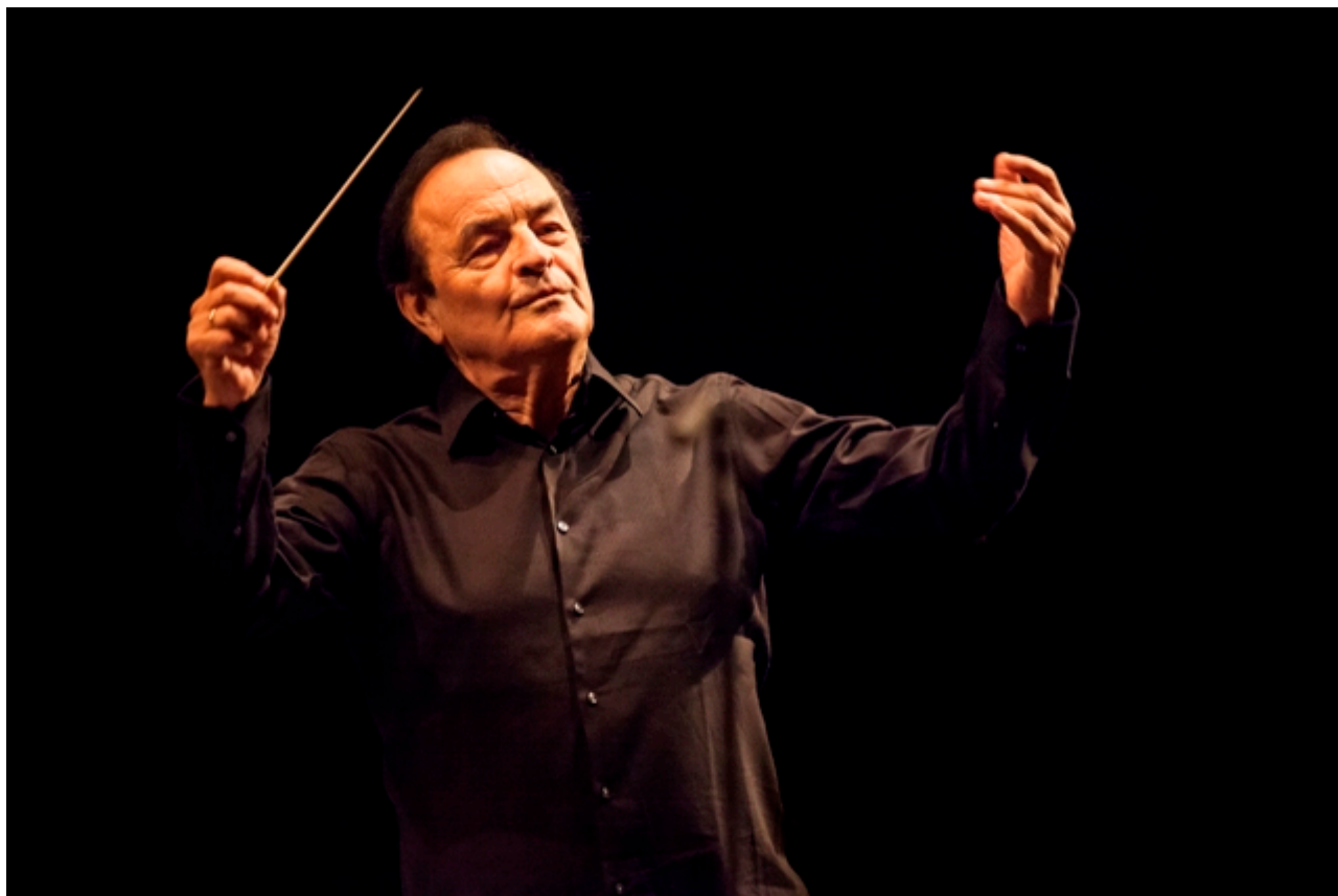
Маэстро Шарль Дютуа