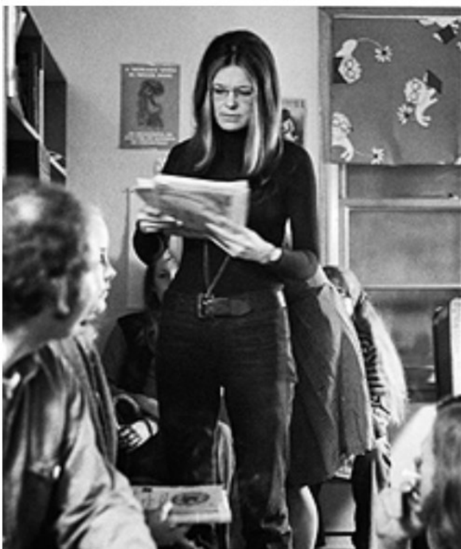
Глория Стайнем выглядит современно в каждом десятилетии