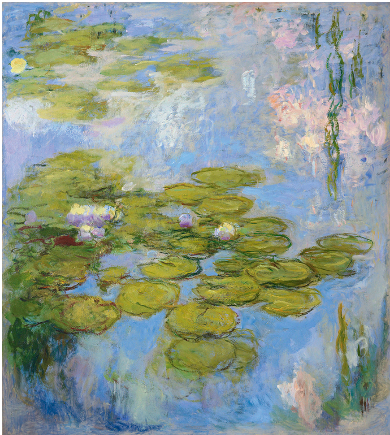
Клод Моне. "Кувшинки", 1916-1919 Масло, холст, 200 x 180 cm (Fondation Beyeler, Riehen/Bâle, Collection Beyeler)