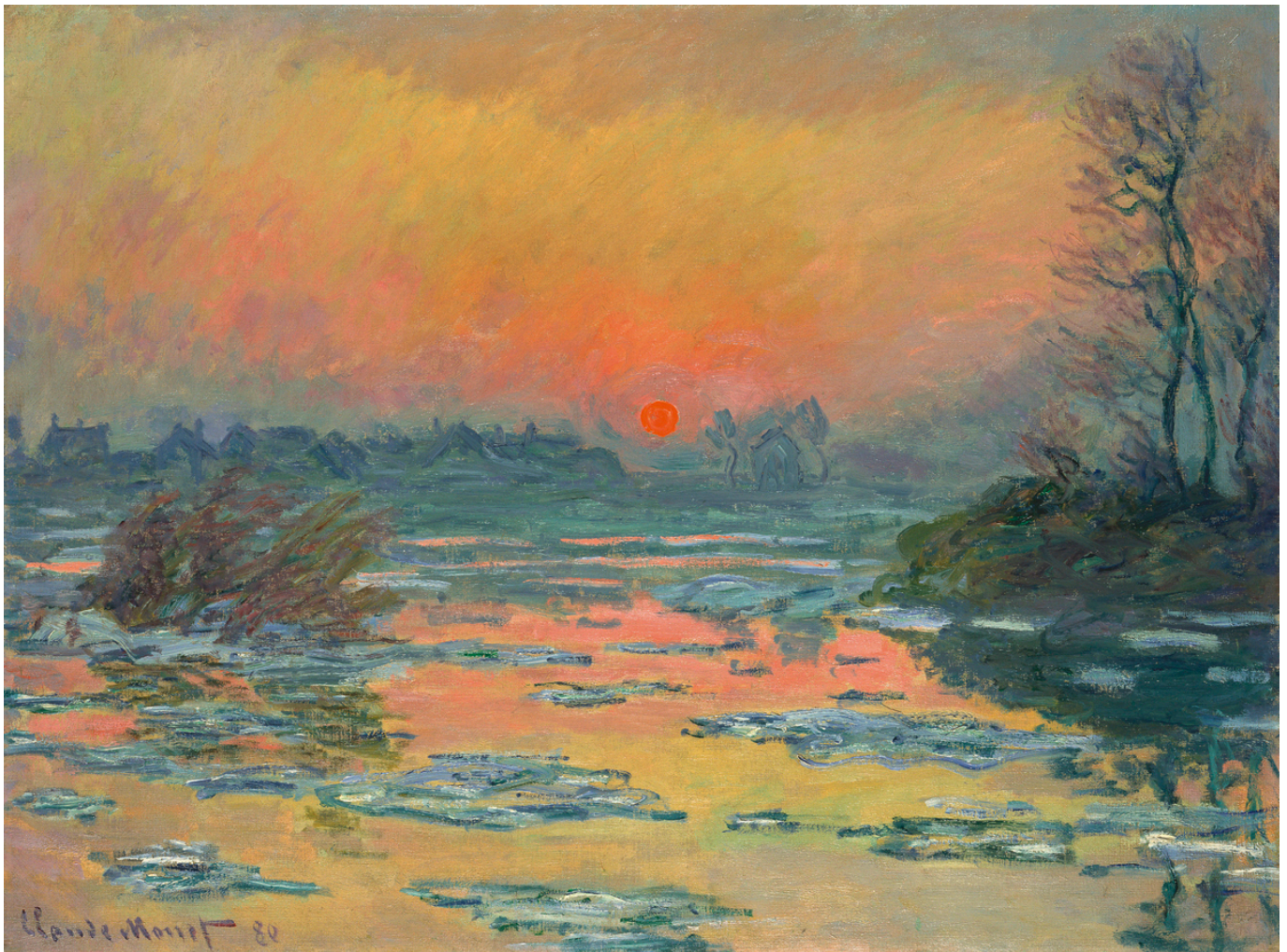
Клод Моне. Заход солнца над Сеной, зима, 1880. Масло, холст, 60,6 x 81,1 cm (Pola Museum of Art, Pola Art Foundation)

В выставленных в Фонде Бейлера работах Моне исследовал игру света и красок, сравнивая их в разное время дня и в разные времена года. Используя отражения, отблески и тени, Клод Моне смог создать в своих картинах поистине чарующую атмосферу, найти ключ к «волшебному саду» современной живописи и предложить всем новое видение мира.