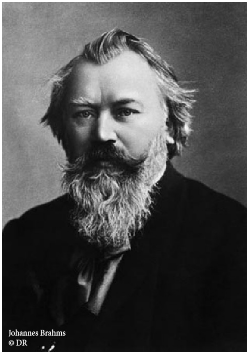
Иоганнес Брамс (1833-1897)

В 2009 году, блестяще дебютировав с Национальным молодежным оркестром Великобритании, он стал главным дирижером коллектива и оставался на этом посту до 2013 года. С Ливерпульским филармоническим и Национальным молодежным оркестром Великобритании дирижер неоднократно участвовал в фестивале BBC Proms. С сезона 2013/14 Петренко занимает должность главного дирижера Филармонического оркестра Осло (Норвегия).