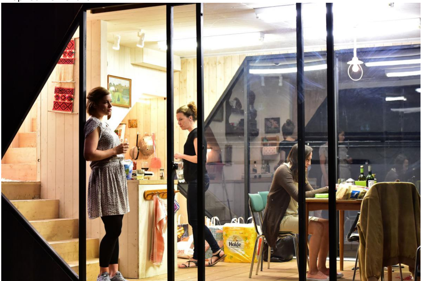
Сцена из спектакля "Три сестры"

Наступивший душевный диссонанс, а попросту – внутренний протест против искажения художественной ткани произведения увеличился после начала спектакля и длился достаточно долго. Видимая реальность сценических «Трёх сестёр» беспощадно ломала и разрывала на куски абсолютно всё, чем мы дорожим в творчестве Чехова.