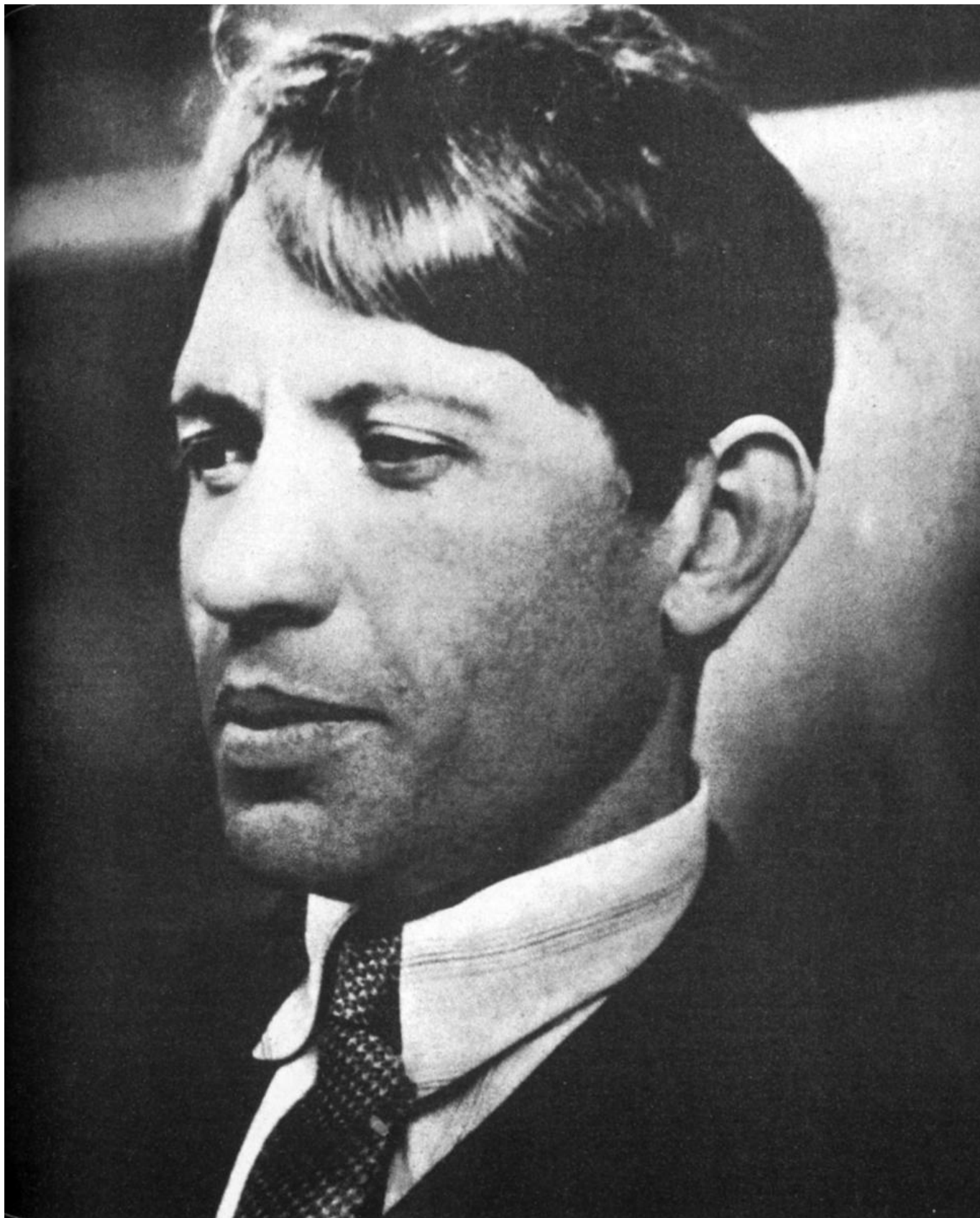
Художник Хаим Сутин (1893-1943)

Ральф Дутли сумел написать роман, как картину. Преобладающие цвета в ней – черный (цвет погромов, катафалка, фашистских униформ, ночи, язвы, голода) и белый (цвет молока, рая, любимых женщин, передышек от боли и безболезненного будущего), с то и дело врывающимися яркими красками французских пейзажей, дошедших до нас в неподражаемой сутинской манере. При этом цвет раздражает