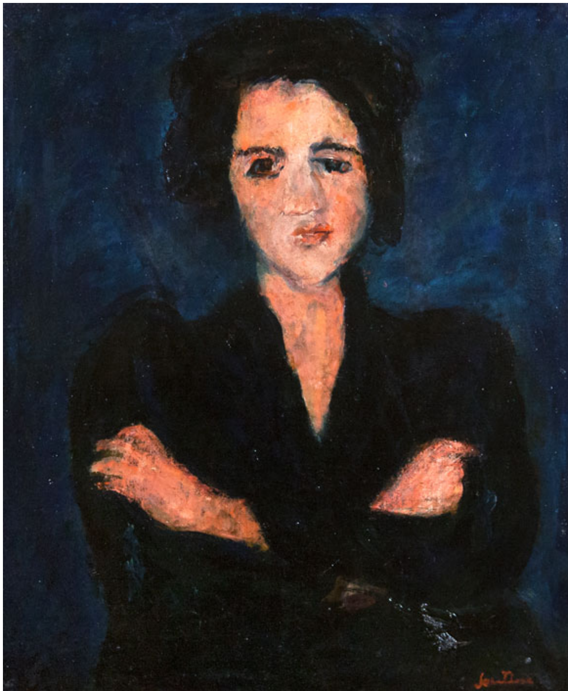
Хаим Сутин. Ева (1928)