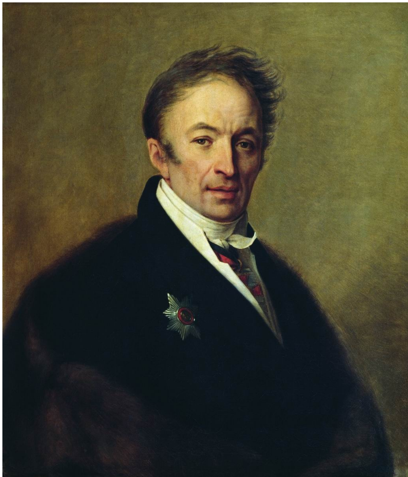
А. Г. Венецианов. Портрет Н.М. Карамзина. 1828

В 1789 году молодой русский автор Николай Карамзин, родившийся 1 декабря 1766 года в селе Знаменское Симбирской губернии (теперь Карамзинка Ульяновской области, при этом есть мнение, что он родился в Оренбургской губернии), отправился в путешествие по Европе и в 1790-м вернулся в Россию. Написанные им по возвращении «Письма русского путешественника» стали уникальным явлением во всей русской культуре. В «Письмах...» путешествие предстало не только как способ