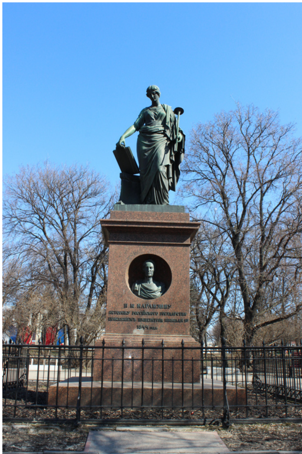
Памятник Н. М. Карамзину в Ульяновске

Одним словом, друзья мои, путешествие питательно для духа и сердца нашего. Путешествуй, ипохондрик, чтобы исцелиться от своей ипохондрии! Путешествуй, мизантроп, чтобы полюбить человечество! Путешествуй, кто только может!».